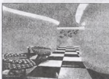
Рис. 1. Інтер'єр готелю в Сінгапурі Spaces

Враховуючи вищезазначені вимоги до готелів такого класу, можна запропонувати наступні дизайнерські рішення. В номерах має бути якомога менше меблів, потрібно використовувати трансформовані меблі, оскільки таким чином можна збільшити місце для розміщення гостей, а також для їх відвідувачів та знизити можливість завдання шкоди майну готелю, адже вболівальники не завжди в змозі стримувати свої емоції та відчуття, під час перегляду спортивних змагань. Загромадженість меблями можна замінити поєднанням різних відтінків стін, підлоги, стелі. Вболівальникам особливо прийде до смаку, якщо розробити номери готелів в кольорах та стилістиці