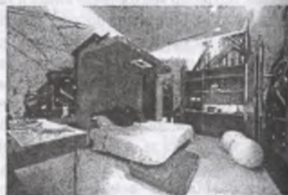
Рис. 2. Готель Permanent Hospitality