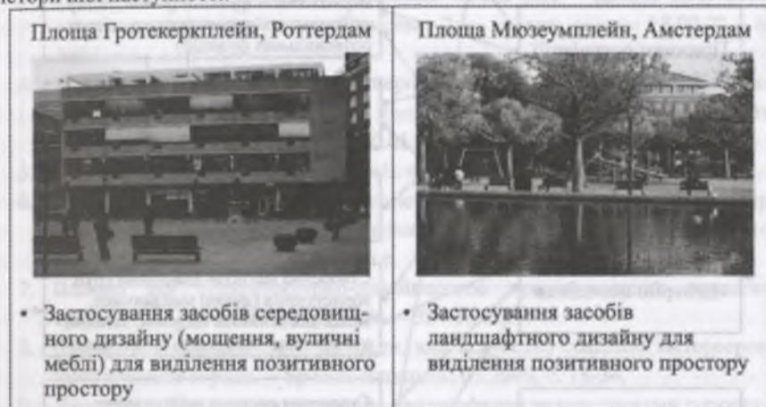
Рис. 4. Прийоми реалізації принципу акумулювання позитивного простору.

Повернення до традиційних типів міських просторів, що набуває все більшого значення, сьогодні здійснюється шляхом реалізації принципу акумулювання позитивного простору. Позитивним в сучасній західноєвропейській містобудівній літературі прийнято називати простір, що на відміну від відкритого перетікаючого простору має певні визначені межі [10]. Ці межі можуть визначатися як забудовою, так і засобами середовищного або ландшафтного дизайну. В досліджуваних містах акумулювання позитивного простору використовується здебільшого для створення затишних приватних ділянок на великих відкритих міських площах (як рекреаційні майданчики на Мюзеумплейн в Амстердамі). Однак, на площі Гротекеркплейн у Роттердамі цей принцип застосований з зовсім іншою метою – за допомогою малюнку мощення та розташування вуличних меблів підкреслюється традиційна компактна морфологічна будова простору міської площі (див. рис. 4). Таким чином в певній мірі цей прийом реалізовує принцип історичної наступності.