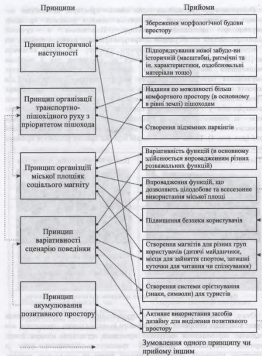
Рис. 5. Принципи та прийоми організації міських площ західноєвропейських міст (на прикладі міст Нідерландів)