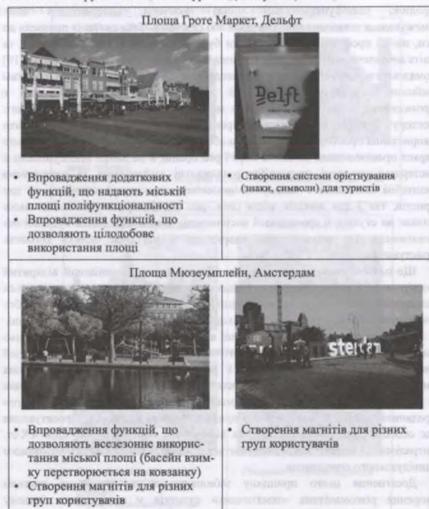
Рис. 3. Прийоми реалізації принципів організації міської площі як соціального магніту та варіативності сценарію поведінки для різних груп користувачів

Крім варіативності функціонального насичення та морфологічної будови різних ділянок відкритого міського простору, на сьогоднішній день проектна етика вимагає врахування інтересів таких специфічних груп користувачів, як маломобільні групи населення та туристи (див. рис. 3).