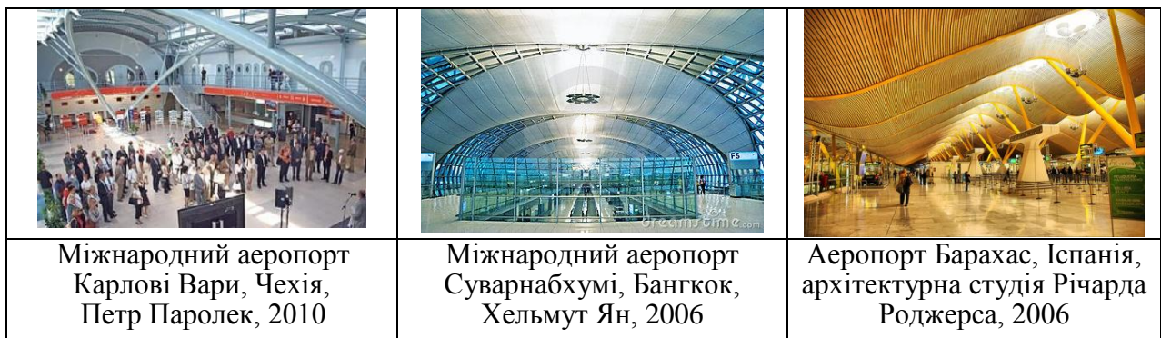
Рис. 1 – Конструкції стель та опор аеровокзалів.

Даний стиль стверджує, що технологія більш красива, ніж твори мистецтва. Це твердження відображується в оформленні інтер'єрів аеропортів, особливо в конструкціях стель, та опор, котрі їх підтримують (рис.1).