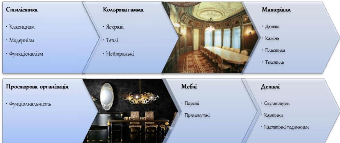
Рис. 4. Уточнення стилістичних та інших рішень, виходячи із уподобань психотипу «винахідливий дослідник»

Висновки. Таким чином, показано доцільність використання методів визначення психологічного комфорту для пошуку кореляцій між специфічними психологічними потребами та архітектурними і дизайнерськими рішеннями на прикладі житла елітного класу, що має сприяти кращому задоволенню. У наступних дослідженнях такі кореляції і рекомендації будуть розглянуті для житла інших категорій із залученням більших обсягів матеріалу.