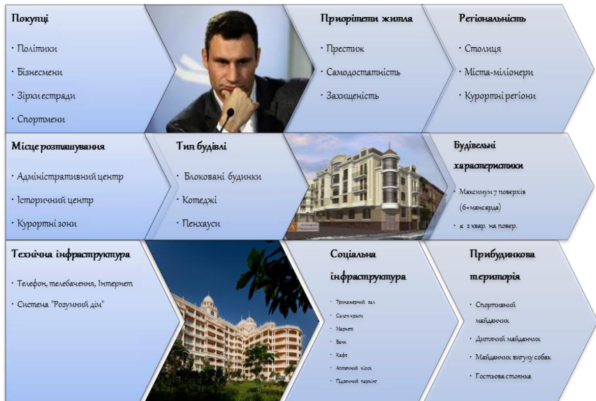
Рис 1. Особливості житла «De lux»

Елітні квартири орієнтовані на дуже багатих людей. Цим пояснюється невелика частка дорого житла в загальних обсягах будівництва 10-12%. Нерухомість категорії «De lux» характеризується наступними особливостями (рис 1).