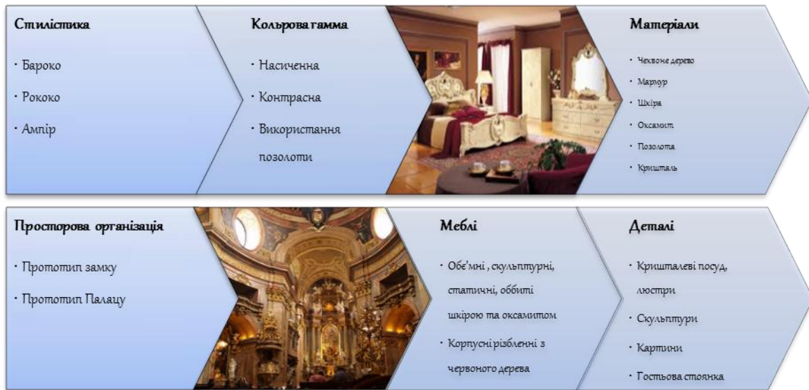
Рис. 2. Уточнення стилістичних та інших рішень, виходячи із уподобань психотипу «егоїст»

Категорія «Premium» відзначається наступними особливостями (рис.3).