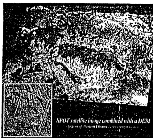
Рис.4. Цифровая модель местности региона Закарпатье (г. Мукачево и г. Свалява)

Последняя из серии экологических катастроф, произошедшая в Закарпатье осенью 1998 года, повлекла очень тяжелые последствия. Наводнением были полностью разрушены 1426 зданий, 1378 зданий были разрушены частично, было затоплено более 100 тысяч гектаров сельскохозяйственных угодий, полностью смыто 254 километра автомобильных дорог, разрушено 20 мостовых переходов. В зависимости от количества воды, которое стекало с водосборной площади, и характера речной долины в период наводнения средняя интенсивность подъема воды в реках Закарпатье достигала 0,6-0,7 м в час, период подъема воды составлял 28-30 часов, а период спада 8-10 суток.