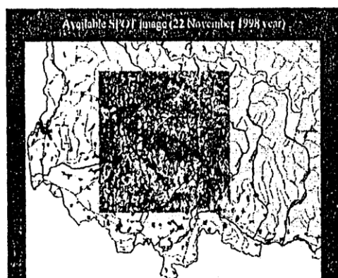
Рис.3. Наложение космического снимка SPOT (Франция) от 22 ноября 1998 г. на карту местности