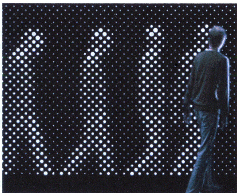
Рис. 1. "Розумна підсвітка"

- засіб світла – один із них – це сукупність світлодіодів, що контролюються комп'ютером і реагують на будь-який рух за допомогою вмонтованої схованої камери. Ці панелі можуть бути різної форми. Камера фотографує рух людини, передає інформацію на комп'ютер, який, у свою чергу, дає зображення на панель. Це нова революційна підсвітка, що вже використовується у сучасних інтер'єрах (Рис.1). Також нині розроблено оптоволоконно, що реагує на інтенсивність оточуючого освітлення. Це дає змогу регулювати світло в кімнаті та створювати кольорові композиції. Ще одна нова технологія – світлові панелі, які загораються за допомогою дотику (Рис.2).