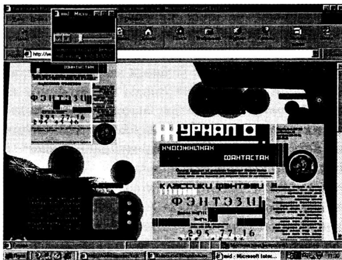
Рис. 1 Web-сторінка, робочий макет

Office 2000 – це остання версія популярного пакету програм, який працює під управлінням операційної системи Windows 95, Windows 98 або Windows NT та містить в собі шість додатків. Заслуговує на увагу нова багатоскладова розгорнута структура буферу обміну файлів, яка дозволяє одночасно вмістити до 12 фрагментів. Новим компонентом Office 2000 є програма Front-Page 2000. Front-Page 2000 – це редактор HTML-документів, за допомогою якого швидко створювати цілі Web-вузли та редагувати Web-сторінки, готуючи їх до опублікування в Інтернеті. В посібнику розглядаються засоби організації гіперпосилань на різні об'єкти локального диску комп'ютера та Інтернету.