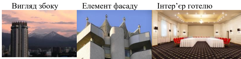
Рис.9. Готель «Казахстан». Алмати, Казахстан

Щодо сучасного розвитку футуристичного стилю в Україні, він широко використовується у дизайні інтер'єрів замських будинків та квартир.