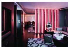
Номер готелю 1