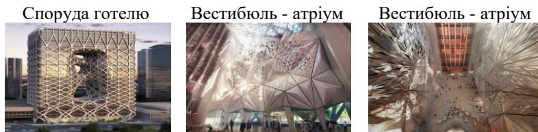
Рис.5. «City of Dreams». Макао, Кумай.

Новий футуристичний готель «Dream Downtown Hotel» у Нью-Йорку. Готель має дванадцять поверхів та включає в себе 316 комфортабельних номерів, два ресторани, терасу на даху, VIP-кімнати відпочинку, басейн з баром під відкритим небом, тренажерний та конференц-зали.