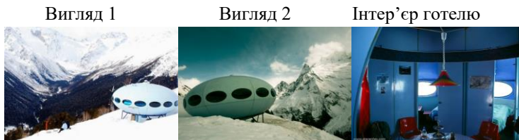
Рис.8. Готель «Тарілка». Домбай, Росія.

Ще одним прикладом радянського футуризму є готель «Тарілка», Домбай, Росія. Побудована в 1969р. на схилі гори Мусса-Ачитара, на висоті 2250м. над рівнем моря. Готель можна перевозити – він розбирається на частини або цілком переноситься за допомогою вертольоту.