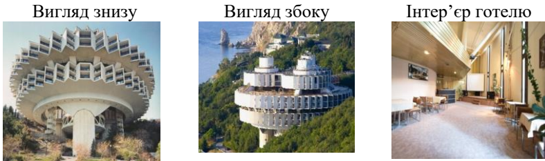
Рис.7. Пансионат «Дружба». Ялта, Крим

76м і шириною 12м, розраховане на одночасне перебування 400 відпочиваючих. Вибір такої форми допоміг вирішити відразу кілька завдань: можливість будівництва на крутому схилі без зміни його природного рельєфу, максимальне збереження існуючої флори, розширити кордон огляду - з вікон відкривається неперевершений вид. Об'єкт цікавий ще й тим, що його опалення, кондиціонування та гаряче водопостачання здійснюються за рахунок теплової енергії Чорного моря.