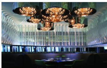
Рис.3. Готель «Mira», Гонконг.

В дизайні інтер'єру багато новітніх технологій, у номерах - велика частина поверхонь білі і міняють колір залежно від налаштування освітлення. Нестандартне і рішення в обробці стіни чорною шкірою в узголів'я ліжка (рис.4).