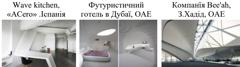
Рис.1. Дизайн інтер'єру у футуристичному стилі

урбаністичного майбутнього. Кольори в інтер'єрі стримані і лаконічні: білий, сірий, бежевий, сріблястий. Допускаються точкові вкраплення яскравих кольорів (рис.1).