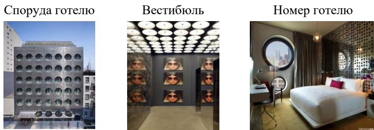
Рис.6. «Dream Downtown Hotel». Нью-Йорк, Америка

Незвичайний дизайн всередині обумовлений інтер'єром, в якому переважає тематика кола та кулі (кулеподібні лампи і меблі) та плавні лінії, а фасад будівлі з нержавіючої сталі з вікнами-ілюмінаторами (рис.6).