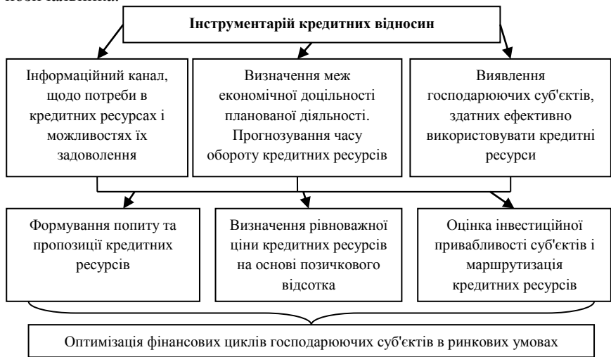
Рисунок 2. – Роль кредитних відносин в господарюючій системі України

статусу, і сукупності виконуваних суб'єктами господарських ролей. Інтерпретативна раціональність полягає в адекватних діях позичальника, щодо вимог кредитора і кредитора – щодо можливостей позичальника.