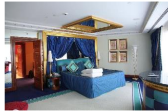
Рис. 2. Використання дзеркальних вставок на стелі

Практика використання дзеркальних поверхонь широко застосовується в стилі оп-ар, який ще з часів появи привернув увагу дизайнерів для створення інтер'єрів громадського простору.