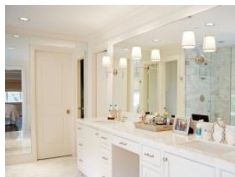
Рис.1. Розміщення дзеркал біля джерел світла

Якщо дзеркала висять під кутом, може виникати неприємне відчуття спотворення простору. Якщо використовувати дзеркала на двох протилежних стінах, створиться ефект нескінченного простору, що може викликати у гостя дискомфорт. Тому перш ніж розмістити дзеркало, потрібно перевірити, що саме буде відобразитися в ньому.