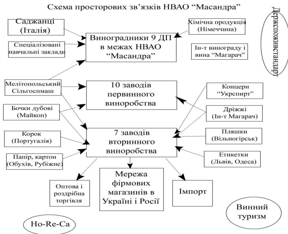
Рис.2. Взаємозв'язки у виноградарсько-виноробному кластері, на прикладі НВАО «Масандра»

значна централізація всередині утворення та розвинені вертикальні зв'язки між підприємствами. До того ж, активну участь у постачанні імпортних матеріалів для виноробства, беруть посередники. Наприклад, ТОВ «Континент», епізодично імпортує корок із Португалії, безпосередньо для НВАО «Масандра». Низка інших фірм забезпечують зовнішньоекономічні та логістичні операції з Росією, Італією, Німеччиною та іншими країнами.