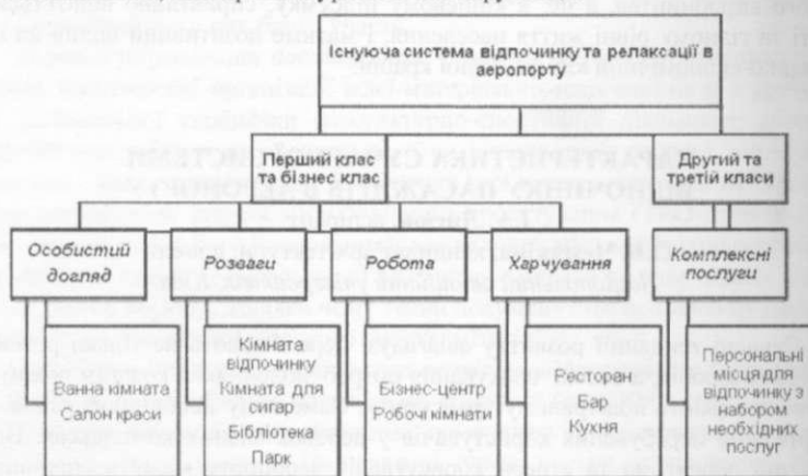
Рис. 1. Існуюча система відпочинку та релаксації в аеропорту

Проведений аналіз показав, що складовими сучасної системи відпочинку є: особистий догляд, розваги, робота, харчування та комплексні послуги (рис. 1). Проте їх недостатньо для повної реалізації надання комплексного відпочинку. Аналіз проектного досвіду подібних місць для відпочинку виявив функціональні та планувальні недоліки у їх влаштуванні – не повне забезпечення потреб, розосередженість системи, обмежений доступ до відпочинку різних груп користувачів та недовга тривалість їх перебування, спроба вирішити проблеми з економічної, а не архітектурної точки зору тощо.