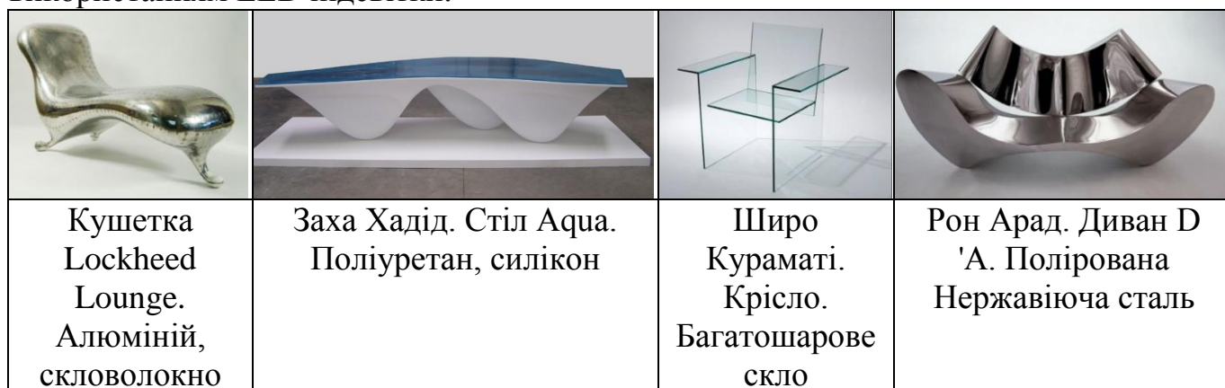
Рис. 3 – Зразки об'єктів арт-дизайну

Об'єктами арт-дизайну, формально, є меблі, аксесуара, предмети інтер'єру (рис. 3), але не в звичному розумінні слова. Це є декоративні композиції на тему вільно інтерпретованих образів - виробів тих чи інших груп, видів і типів, що часто переплітаються з образами, запозиченими з інших видів мистецтв. Це прототипи, призначені не для масового виробництва, а для експозиціонування в залах арт галерей, або моделі, що виготовлені обмеженими серіями часом із рідкісних і дорогих матеріалів. Для виготовлення предметів в стилі арт-дизайн використовують: мармур, метали, деревина, скло, кераміка, пластмаси, гума, фарби, тканини, трикотаж, шкіра, хутро, самоцвіти, камінь, тощо. Інколи вдаються до застосування нових технологій, наприклад світлопередачі із використанням LED підсвітки.