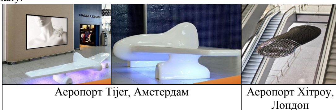
Рис. 4 – Приклад використання об'єкту арт-дизайну в інтер'єрі аеровокзалу

Відмінність та особливість зосередження об'єктів арт-дизайну в приміщеннях залів аеровокзальних комплексів, на відмінно від галерей та виставок, полягає у акцентному сприйнятті відвідувачем експозиційної моделі (рис. 4), оскільки пасажир у стані психофізичного збудження перед технологічним процесом не розраховує на зосередження в приємному вражаючому естетичному середовищі. Накладений відбиток арт-дизайну на предмети не тільки інсталяційного характеру, але й на предмети промислового дизайну, створює певну ізіюминку в інтер'єрі аеровокзалу.