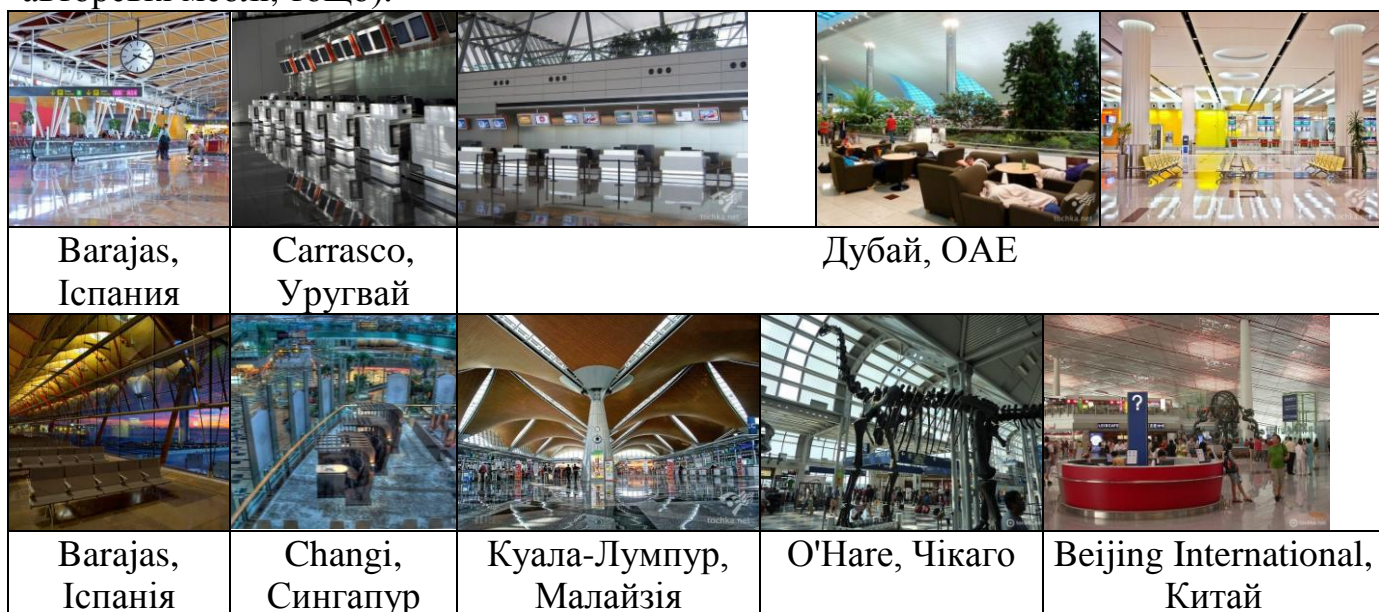
Рис. 1 – Приклади інтер'єрів аеровокзалів світових аеропортів

Візуальний аналіз сучасних світових аеровокзальних комплексів (рис. 1) дає розуміння облаштування внутрішнього простору залів аеровокзалу та показує, що інтер'єри аеровокзалів наповнені великою кількістю предметів мебельного призначення, декоративними елементами та об'єктами арт-дизайну (скульптури, авторські меблі, тощо).