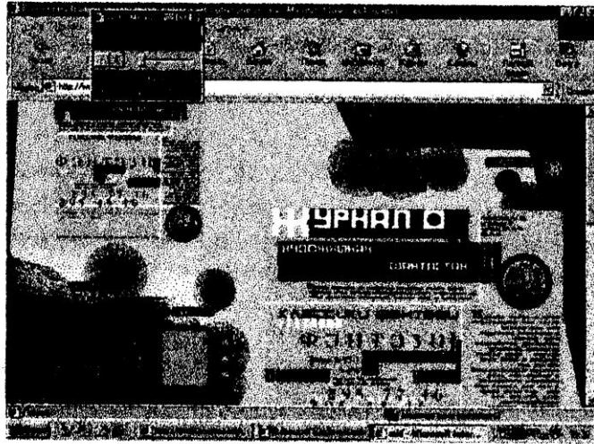
Рис. 1 Web-сторінка, робочий макет

O ffice 2000 – це остання версія популярного пакету програм, який працює під управлінням операційної системи Windows 95, Windows 98 або Windows NT та містить в собі шість додатків. Заслуговує на увагу нова багатоскладова розгорнута структура буферу обміну файлів, яка дозволяє одночасно вмістити до 12 фрагментів. Новим компонентом Office 2000 є програма Front-Page 2000. Front-Page 2000 – це редактор HTML-документів, за допомогою якого швидко створювати цілі Web-вузли та редагувати Web-сторінки, готуючи їх до опублікування в Інтернеті. В посібнику розглядаються засоби організації гіперпосилань на різні об'єкти локального диску комп'ютера та Інтернету.