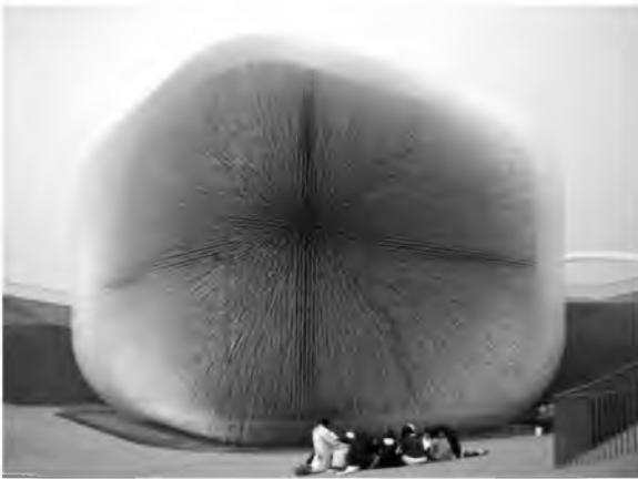
Рис.1. Кактус циліндропунція

імітації закономірностей та структурування природних форм. Завдяки сучасним технологіям і будівельним матеріалам забезпечується формоутворення в параметричній архітектурі на основі біонічних принципів. В основу покладені ідеї взаємодії з навколишнім середовищем, можливістю постійного росту та розвитку. Формування внутрішнього простору (інтер'єру) розглядається у зв'язку з екстер'єром (зовнішнім середовищем) та являється його логічним продовженням та розвитком. В основі біонічного принципу формоутворення лежить запозичення прикладів зі світу природи, а параметричне моделювання є інструментом для реалізації цього принципу (рис. 1, 2).