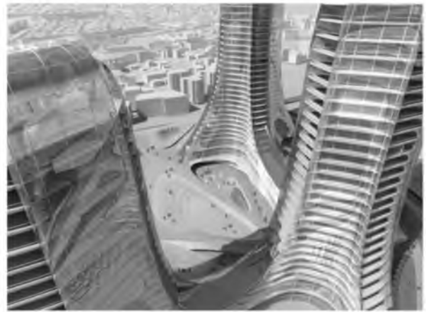
Рис. 6. Крупний план кутових башен, Zaha Hadid Architects, Стамбул, Турція.