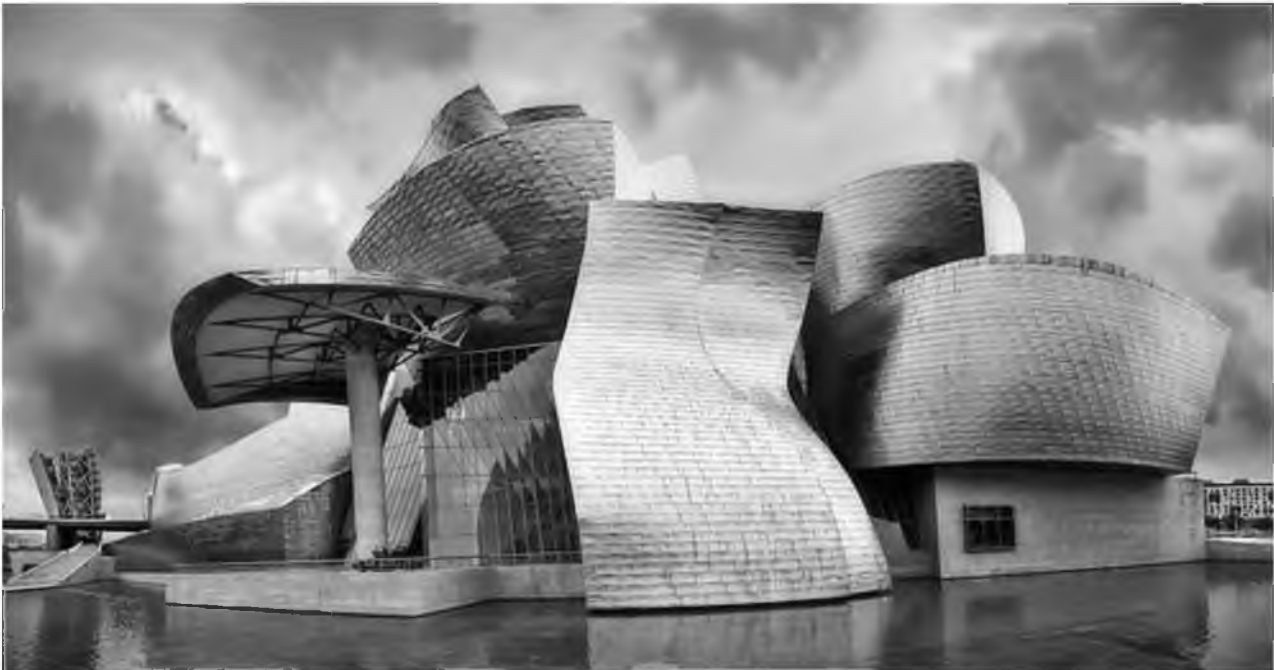
Рис.3. Музей Гуггенхайма у Більбао. Архітектор Френк Ф. Генрі 1997р.

Френк Ф. Генрі у 1997 проектував будівлю вручну, правда розрахунки проводились на комп'ютері. Музей був створений за допомогою комбінування елементів способом, який міг би використовуватися для будь-якої будівлі за участю необхідної техніки та апаратури - всі елементи легко комбінуються залежно від вимоги. На перший погляд це позбавляє його своєї оригінальності. Тим не менше музей Гуггенхайма можна оцінити як неймовірно важливий прорив мислення архітектора та перехід до параметричної архітектури (рис.3).