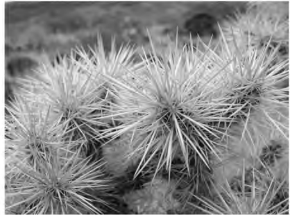
Рис.2. Будівля Експо у Шанхаї, Китай 2010р.

Параметризм – це новий унікальний стиль в архітектурі. Перші риси цього напрямку почали зароджуватись у 1990-х роках, але остаточне формування припадає на останні роки завдяки величезному кроку в розвитку систем параметричного моделювання. Цей великий, після модернізму, стиль претендує на лідерство в авангардній архітектурі, стає сьогодні домінантним моностилем та новою хвилею нововведень та новацій від інтер'єра до містобудування. Дигітальна архітектура поєднує у собі математику, скульптуру та архітектуру. У процесі моделювання архітектор інколи перестає бачити кінцевий результат об'єкта, він захоплений алгоритмом створення.