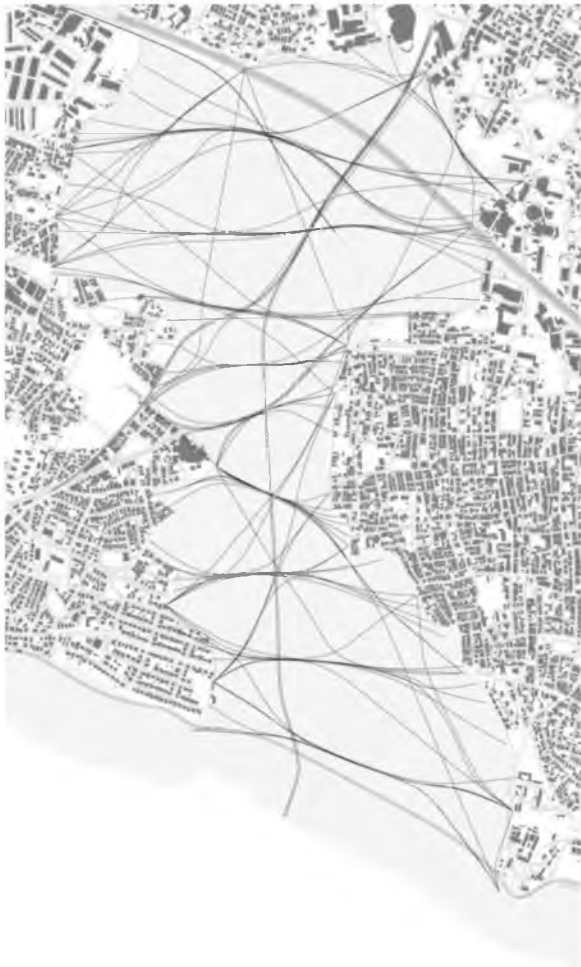
Рис. 5. Генеральний план Kartal-Pendik, Стамбул, Турція, 2006 р