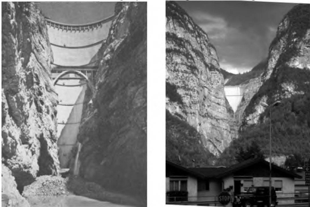
Рис.4. Гребля Вайонт, Італія

Після повного заповнення водосховища на горі Ток з'явилися перші тріщини. Вони протягнулися уздовж всієї гори на 4 км. Біля греблі ширина розлому досягала 4 м. Геологічні дослідження показали, що у будь-якому випадку гора сповзе донизу, питання постало лише у часі. Коли рівень води досягнув 190 м, в листопаді 1960 року стався перший обвал гори Ток.