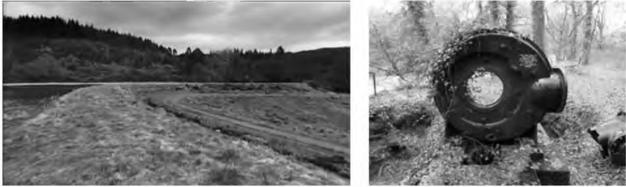
Рис.2. Околиці будинку Лорда Вільяма Армстронга і турбіна Томсона

Так лорд Армстронг проклав дорогу у майбутнє будівництво гребель і гідроелектростанцій. Його винахід став справжнім стартом у галузі гідроенергетики - людина винайшла дешевий, екологічно чистий вид виробітку електроенергії. Уроки, отримані під час будівництва перших гребель, дали дорогу новому поколінню суперспоруд, які були ширшими, вищими, потужнішими і величнішими, ніж їх попередники.