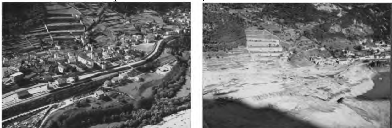
Рис.3. Селище Лонгароне до та після аварії на греблі Вайонт, Італія

У 1959 році італійці з великою гордістю і шаленим ажіотажем відкрили греблю Вайонт, яка була частиною нової Італії і носила титул найвищої греблі світу. Саме через неї сталася найгучніша трагедія не тільки в історії Італії, а й в усьому світі. Жахлива аварія, від якої не врятувався майже ніхто, почалася з того, що якимось вночі в усьому містечку згасло світло. Потім над греблею здійнялася 200-метрова хвиля води і з величезною швидкістю обрушилась на будівлі. Мільйони кубометрів води велетенською хвилею перелилися через край греблі і стерли з лиця землі саме містечко та інші розташовані поряд невеликі селища, залишивши після себе "місячний пейзаж". На рисунку 3 показано селище Лонгароне до та після трагедії.