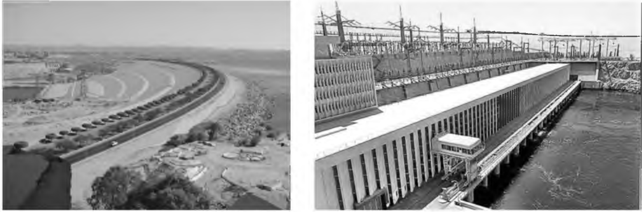
Рис.8. Загальний вигляд Асуанської греблі

Висотна Асуанська гребля розташована на півдні Єгипту. Її будівництво стало епічним проектом. На її спорудження пішло стільки матеріалу, що можна було б побудувати величну піраміду в Гізі 17 разів. Асуанська гребля висотою 111 метрів побудована із землі і кам'яної породи, вона стоїть на глиняній основі з бетонною поверхнею. Єгипет являється найспекотнішою країною на планеті та має на своїй території ріку Ніл – справжнє природне багатство. Кожного літа ріка виходить з берегів і залишає після повені плодючий шар мулу. Це добре для фермерів, але річка непередбачувана: якщо повінь не відбувалася, засуха вражає тих, хто оселявся біля річки. Асуанська гребля буда побудована, щоб втримати воду в період повені і випустити під час засухи.