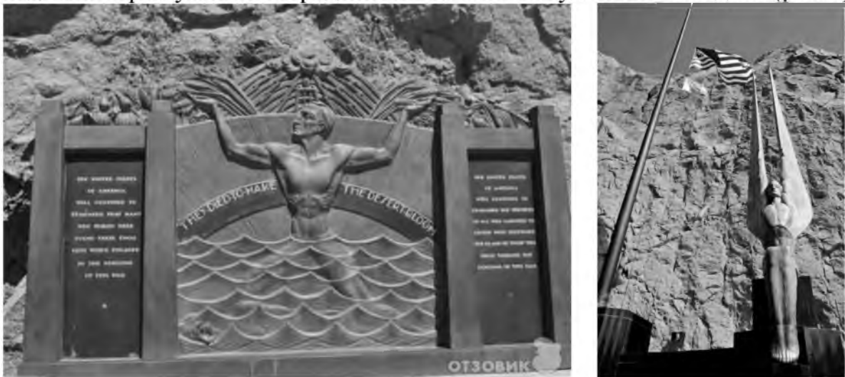
Рис.7. Пам'ятні споруди, присвячені будівельникам, які загинули під час зведення греблі

Слід зазначити, що жодна гребля у світі не була так прикрашена. Красоту і витонченість надає величній споруді стиль «арт-деко», в якому вона побудована і оформлена. Ходять легенди, що тіла загиблих будівельників греблі до сих пір блукають всередині. Їх пам'ять шанують і по сей день (рис.8).