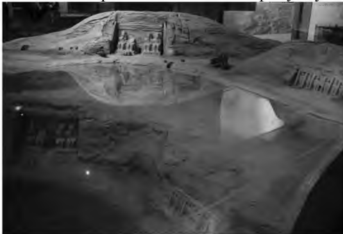
Рис.9. Масштабна модель храму Абу-Сімбел, яка демонструє нове і старе місце храму і рівень води річки Ніл.

Будівництво розпочалося 1960 року, але одразу зупинилось. Стало очевидно, що на завершальному етапі будівництва, коли рівень водосховища мав максимально підвищитися, багато єгипетських пам'яток може опинитися під загрозою. Археологам довелося дуже багато попрацювати - кожний об'єкт потрібно було розібрати і зібрати на більш високому місці. Так було врятовано 23 відомих пам'ятники. Приклад наведено на рисунку 9.