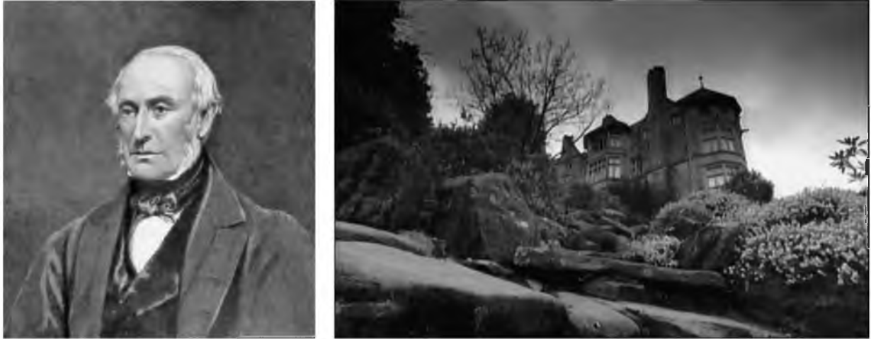
Рис.1. Лорд Вільям Армстронг і його будинок

У XIX столітті Британія стала осередком промислової революції. Одним із її рушійників був лорд Вільям Армстронг. На рисунку 1 представлено фото лорда Вільяма та загальний вигляд його будинку.