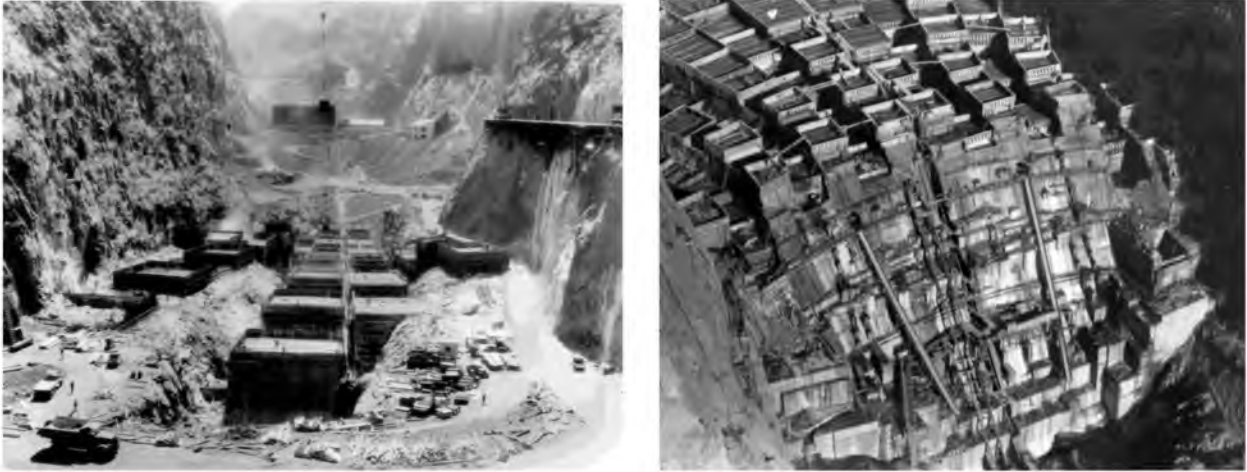
Рис.6. Колони Греблі Гувера

Слід зазначити, що жодна гребля у світі не була так прикрашена. Красоту і витонченість надає величній споруді стиль «арт-деко», в якому вона побудована і оформлена. Ходять легенди, що тіла загиблих будівельників греблі до сих пір блукають всередині. Їх пам'ять шанують і по сей день (рис.8).