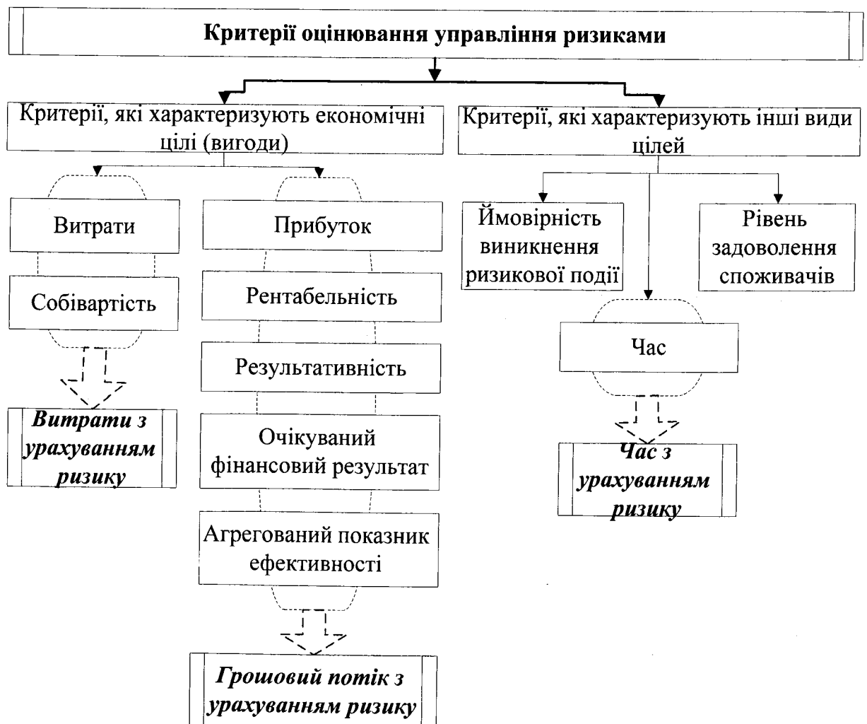
Рис. 1. Основні критерії оцінювання управління ризиками в діяльності транспортного підприємства

Отже, комплексний критерій оцінювання управління ризиками транспортного підприємства – це сукупність параметрів часу, витрат (доходів) через врахування умов ризику впродовж виконання всіх необхідних процесів при здійсненні постачання. Тому цільова функція даного критерію повинна виражати мінімум загальних витрат на постачання, мінімум сумарних витрат часу, а також враховувати обмеження на час доставки та на обсяг фінансових ресурсів.