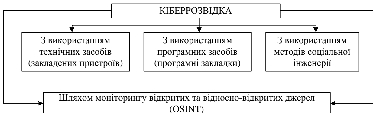
Рис. 2. Складові кіберрозвідки

Зважаючи на те що силами і засобами РсТ та МР добувається відповідно до 5–8 % та до 7 % інформації, яка необхідна протиборчим сторонам одна про одну, останнім часом надзвичайно розвинувся такий спосіб розвідки ІТС, як КР. Її силами і засобами нині може добуватися від 35 % до 95 % інформації про об'єкти розвідки, яка має властивість не тільки не відрізнятися від військових і державних таємниць, але й часто перевершувати їх за своєю цінністю. Залежно від важливості та специфіки покладених завдань, наявних ресурсів, а також за методами, що застосовуються для пошуку і збору інформації [2], кіберрозвідка ІТС поділяється на технічний і програмний методи її ведення, метод так званої соціальної інженерії (СІ), а також метод, що передбачає моніторинг відкритих і відносно відкритих електронних джерел (рис. 2).