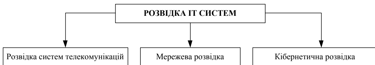
Рис. 1. Способи ведення розвідки ІТС

Під розвідкою ІТС розумітимемо [2, 3] комплекс заходів, спрямованих на систематичний і цілеспрямований пошук та добування з ІТС інформації стосовно протиборчої сторони (конкурента), її вивчення та оброблення, а також формування на цій підставі уявлення про реальні та/або потенціально можливі джерела деструктивного впливу на власний кіберпростір. Від інших видів розвідки ІТС відрізняється перш за все механізмами (способами і методами), а також силами і засобами, що задіяні в добуванні розвідувальної інформації. Головними способами ведення розвідки ІТС (рис. 1) вітчизняні та закордонні фахівці нині вважають розвідку систем телекомунікацій (РсТ), мережеву розвідку (МР) і кіберрозвідку (КР).