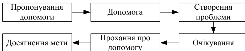
Рис. 3. Принцип оберненої соціальної інженерії

Прикладом такому можуть слугувати троянський проху-сервер “Mitglieder” та ICQ-черв’як “Bizex”, що з’явилися у 2004 році [7, 8]. Перший з них проникав до комп’ютера-жертви через уразливість у Microsoft Internet Explorer, яка дозволяла встановити і запустити проху-сервер на зараженій машині без відома користувача. Після зараження відкривався порт, що використовувався для розсилання спаму. Таким чином, заражені машини утворювали мережу машин-зомбі (ботнет), якими можна було керувати віддалено. Для поширення ICQ-черв’яка “Bizex” порушники використовували масове несанкціоноване розсилання по ICQ повідомлення “http://www.jokeworld.biz/index.html:)) LOL”. Одержавши таке повідомлення об’єкт атаки, що нічого не підозрював, відкривав зазначену сторінку й у випадку, якщо використовувався браузер Internet Explorer з незакритою уразливістю, на комп’ютер завантажувалися файли черв’яка, а в деяких випадках і супутнього йому трояна. Після установки в систему “Bizex” закривав запущений ICQ-клієнт і, підключившись до сервера ICQ з даними зараженого користувача, розсилав спам за знайденими на комп’ютері списками контактів. Одночасно відбувалася крадіжка конфіденційної інформації – банківських даних, логінів і паролів тощо. Алгоритм дій порушників (рис. 4) базувався при цьому на особливостях прийняття рішень звичайними користувачами, професійними шпигунами та/або хакерами, яких у західних інформаційних джерелах нині називають когнітивним базисом [3].