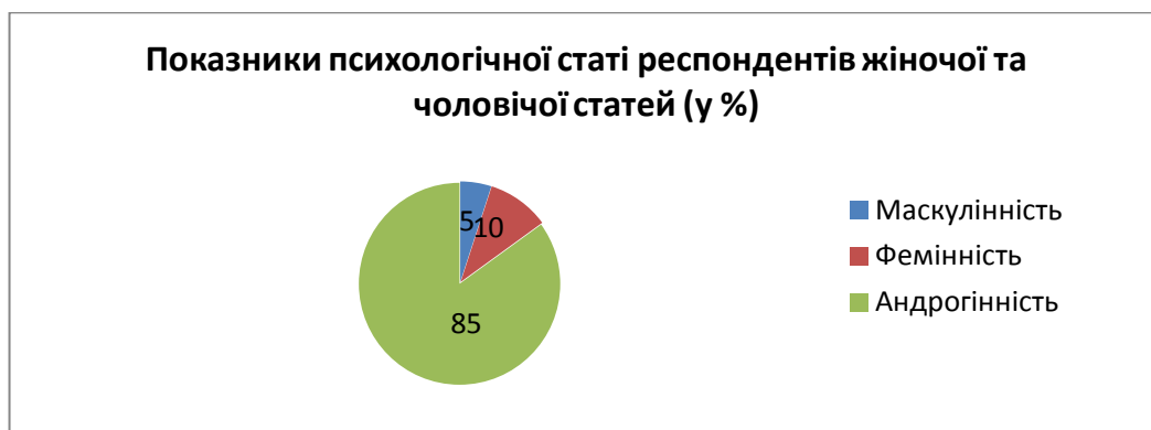
Рис. 1. Результати дослідження за методикою С. Бем

Визначення статевої приналежності було здійснено за допомогою опитувальника С. Бем «Маскулінність - фемінність». Отримані результати вказують на те, що серед представників чоловічої статі лише 10% мають приналежність до маскуліного типу, решта (90%) – андрогінного. В свою чергу, 20% жінок є приналежними до фемінної статі, всі інші (80%) також андрогінні. Узагальнені показники для чоловіків та жінок представлені на рис.1.