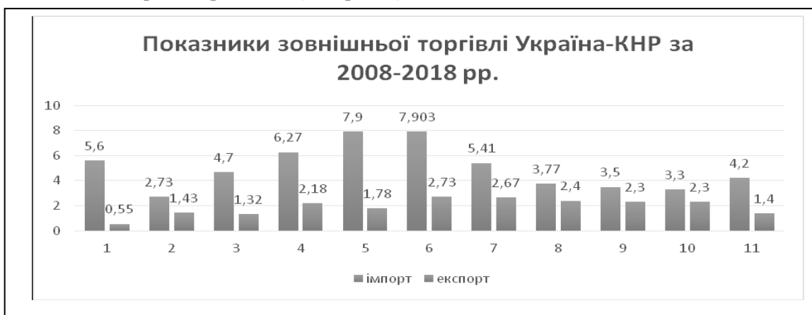
Рис. 1 Показники зовнішньої торгівлі Україна-КНР за 2008-2018 рр.

Китай зайняв перше місце за обсягом зовнішньої торгівлі, перше місце – за експортом товарів, друге – за імпортом товарів, третє – за експортом і друге – за імпортом послуг. Щодо торговельних взаємовідносин України і Китаю, слід відзначити, що спостерігається суттєвий дисбаланс між обсягами експортних й імпорتنних поставок. Протягом 2011-2016 рр. експорт українських товарів і послуг до Китаю перебував у межах 1,9-2,8 млрд доларів США, тоді як відповідні обсяги імпорту сягали 8 млрд доларів США. Максимальне значення коефіцієнту покриття імпорту експортом становило лише 0,63 у 2015 р., мінімальне – досить незначне – 0,23 у 2012 р. Негативне сальдо в торгівлі України з Китаєм у 2012 р. склало 6,1 млрд доларів США, у 2016 році його значення зменшилось до 2,9 млрд доларів США (див. рис. 1):