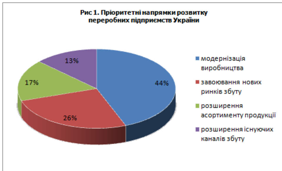
Рис. 2.1. Пріоритетні напрямки розвитку переробних підприємств України. [60]

підприємств. Результати опитування вказали, що більше трьох четвертих респондентів вважають, що переробні підприємства мають залучати інвестиції у розвиток виробництва. Структура пріоритетних напрямків розвитку підприємств подана на рис. 2.1.