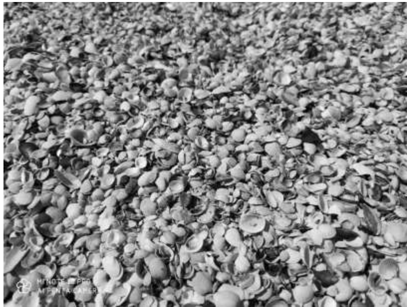
Рис. 1. Мушлі

Інструменти та матеріали: мушлі різної форми та розмірів, гуаш чи акрилові фарби, пензлики.