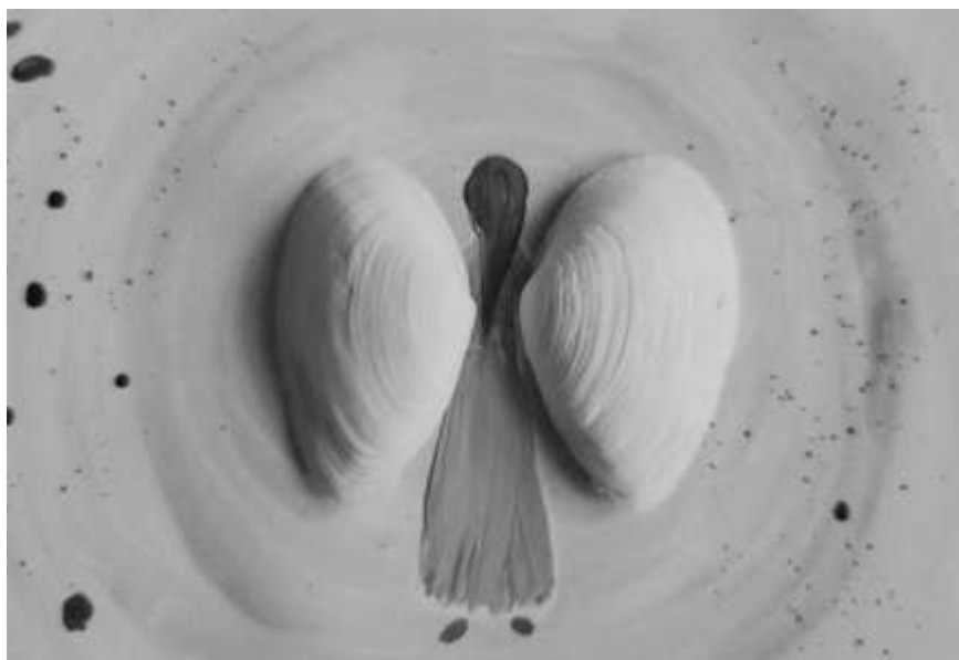
Рис. 4. Ілюстрація до методики «Янголи»

Методика «Замки із піску». Робота із переживаннями стосовно здійснення мрій, переживаннями фрустрації нездійсненності мрії. В основі техніки лежить переживання метафори зведення піщаних замків.