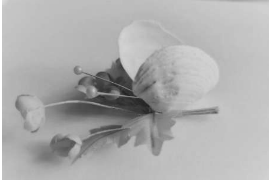
Рис. 2. Ілюстрація до методики «Робота з мушлями – метелик»