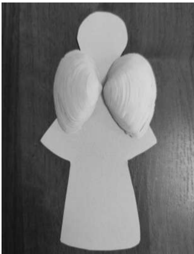
Рис. 3. Ілюстрація до методики «Крила янгола»