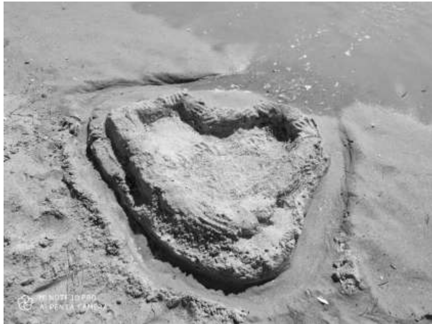
Рис. 5. Ілюстрація до методики «Замки із піску».

Через деякий час, можливо на наступний день чи після припливу погляньте, як змінився Ваш піщаний замок. Чи зруйнувався він повністю, частково, чи його зовсім не зачепило водою?