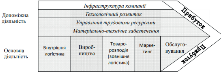
Рис. 1.1. Модель формування ланцюгів створення доданої вартості за М. Портером.