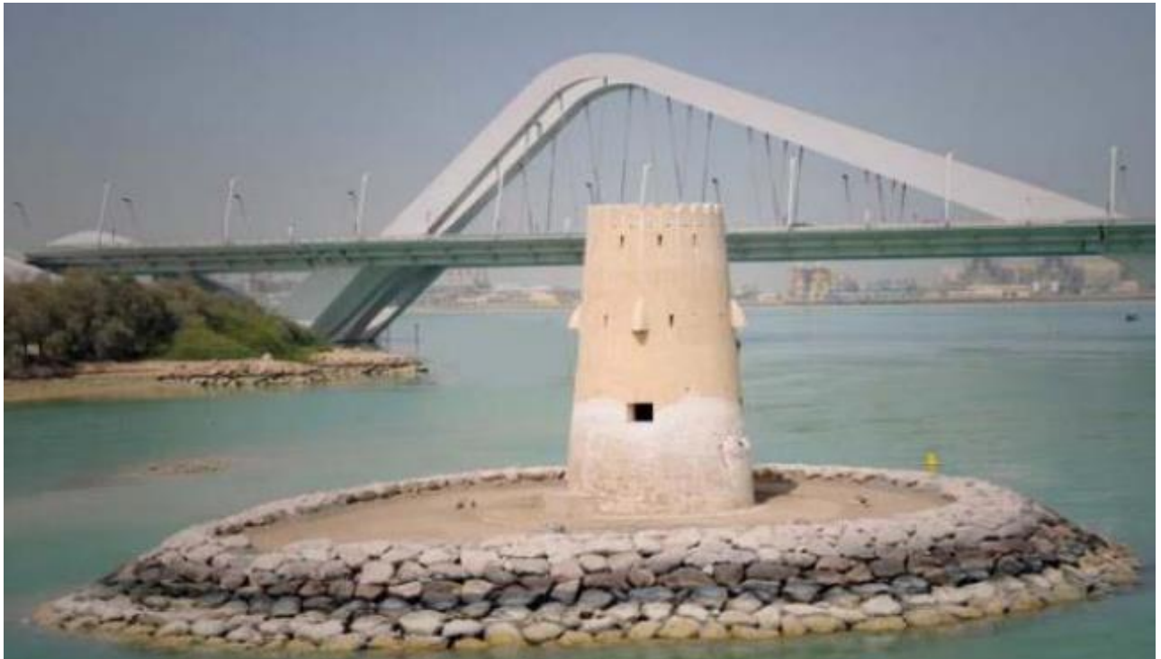
Рис.2.3 Форт Аль Макта

Форт Аль Макта – це один з небагатьох збережених фортів на території Абу-Дабі, якому налічується близько 200 років (Рис. 2.3). Цей форт був побудований в військових цілях для захисту від нападів. Він розташований на невеликому острові поряд з мостом Аль Макта, який з'єднує материк з островом Абу-Дабі. Зараз цей форт є історичною пам'яткою.