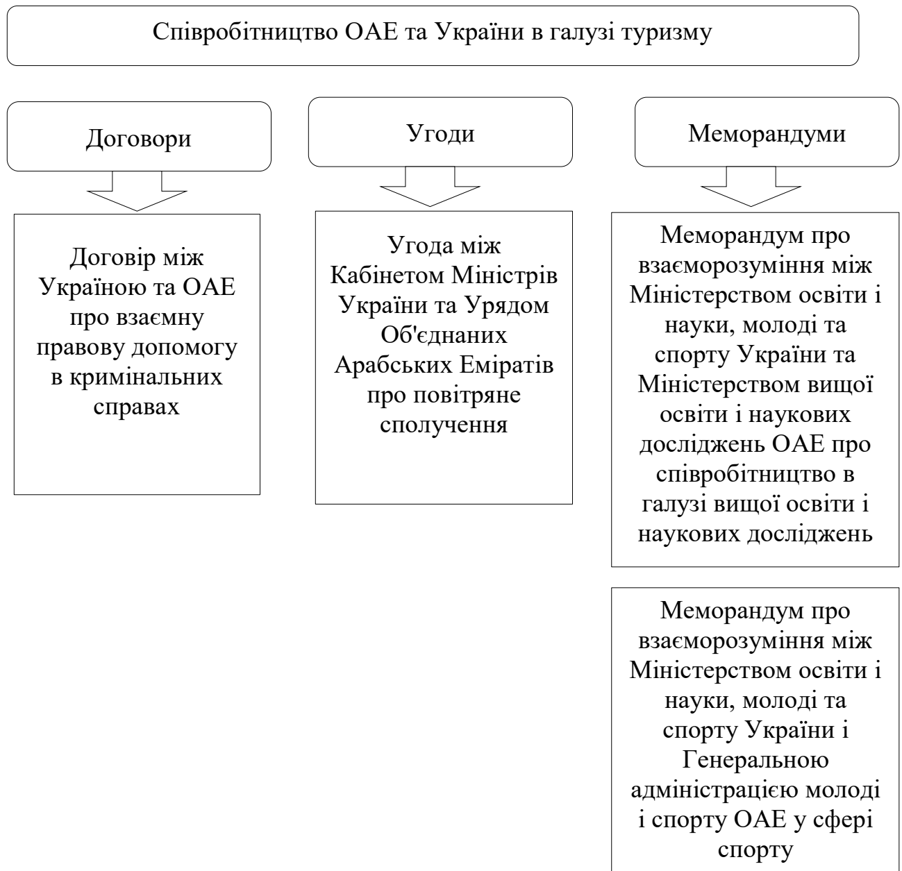
Рис. 3.2. Співробітництво ОАЕ та України в галузі туризму

розгалуження туристичної інфраструктури України та надасть можливість для реалізації низки соціальних проєктів. Країнами-партнерами підписано багато договорів, угод та меморандумів щодо розвитку туризму (Рис. 3.2).