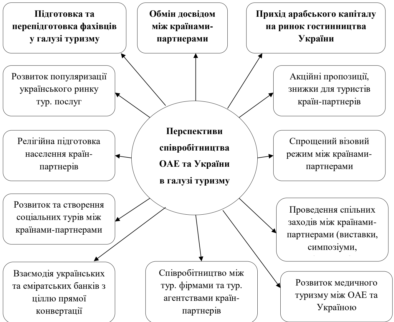
Рис. 3.3. Перспективи співробітництва ОАЕ та України в галузі туризму

та послуг і, перш за все, інвестиційній сфері. Тому Україні треба працювати над цим. Підписання додаткових договорів та угод буде вигідним рішенням як для ОАЕ так і для України, тому ми пропонуємо наступні пункти співробітництва (рис. 5) між ОАЕ та Україною.