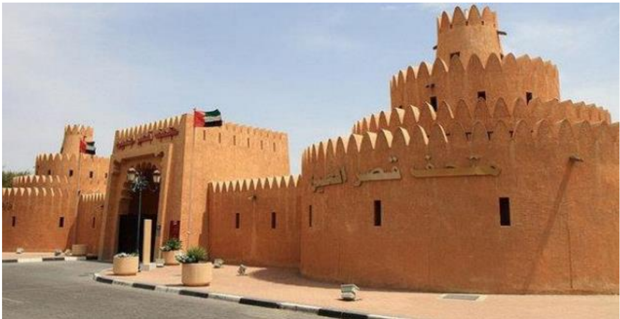
Рис.2.2 Мечеть Шейха Заїда

Мечеть шейха Зайда красива як вдень, коли будівля переливається на сонці білим і золотим кольором, так і вночі, коли будівля і купола висвітлюються штучним підсвічуванням, що змінює кольори залежно від фаз місяця.