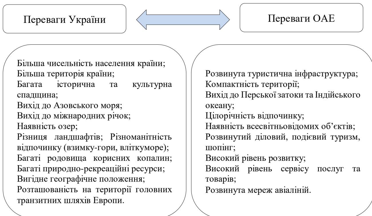
Рис. 3.1 Аналіз переваг України та ОАЕ в туристичній галузі

Об'єднані Арабські Емірати є на сьогодні однією з найвідоміших точок на карті міжнародної туристичної індустрії. Пов'язано це, в першу чергу, з активізацією економічної діяльності. Туристичний бізнес стимулює та розвиває економіку, сприяє появі нових можливостей, які підвищують світовий авторитет ОАЕ [3, с. 12]. На рис. 3.1 зазначено переваги України та ОАЕ в туристичній галузі. На сьогодні туристична діяльність України в незадовільному стані, тому треба швидкими темпами розвивати індустрію туризму, адже Україна має великий потенціал. Важливим кроком для розвитку туризму в Україні є співробітництво з високо розвинутими країнами, однією з таких країн є ОАЕ.