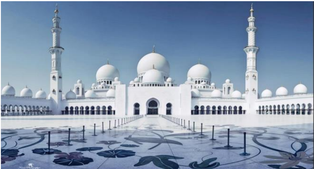
Рис.2.1 Велика Мечеть Шейха Заїда

Велика Мечеть Шейха Заїда (Рис.2.1) є однією з найбільших і найкрасивіших мечетей в світі. Найголовніша пам'ятка Абу-Дабі і всієї країни, Велика Мечеть названа на честь першого президента ОАЕ – Шейха Заїда бін Султана Аль Нахайяна, поховання якого розташоване поруч з мечеттю.