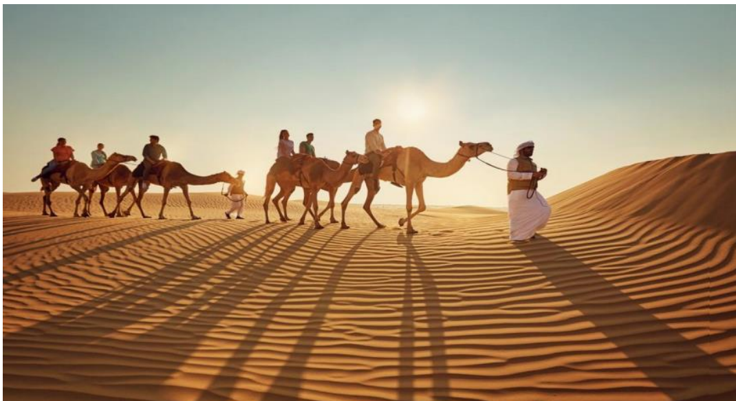
Рис.1.2 «Кораблі пустелі» – верблюди

короткочасні, небезпеки не представляють, супроводжуються досвідченими провідниками. Використовується не автотранспорт, а «кораблі пустелі» – верблюди (Рис.1.2) [39, с. 201].