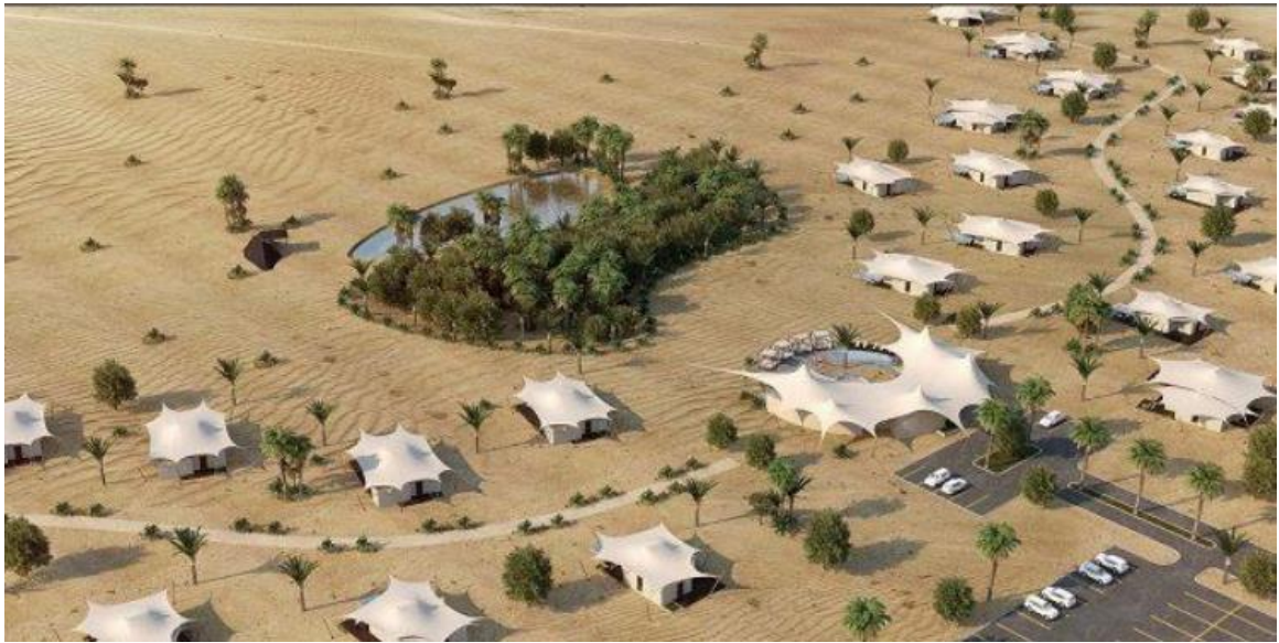
Рис.1.1 Курорт «Mleiha Desert Resort»

центру, басейну. На його території розташується 45 дизайнерських вілл, створених за прикладом традиційних наметів в пустелі, кожна з власним басейном і терасою.