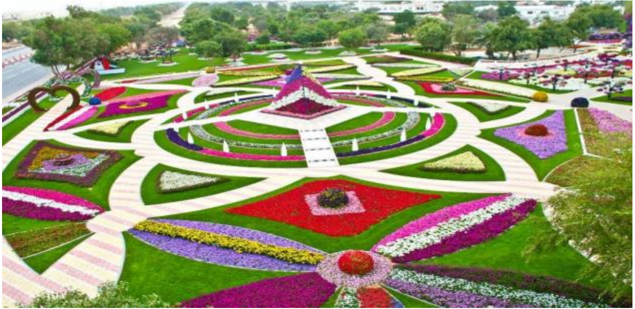
Рис.2.4 Сад квітів Al Ain Paradise Garden