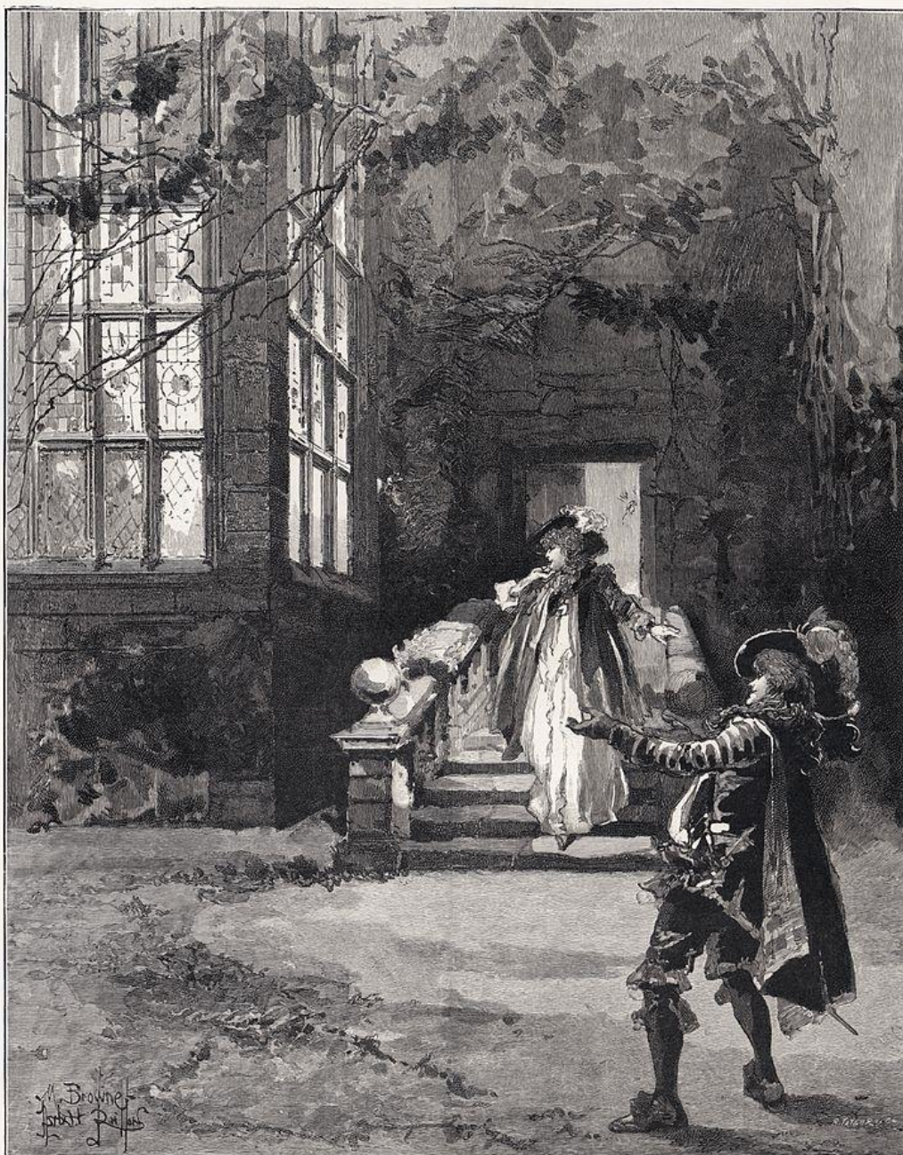
"HADDON HALL," SIR ARTHUR SULLIVAN'S NEW OPERA AT THE SAVOY THEATRE: THE FLIGHT OF DOROTHY VERNON.

TWO SIXPENCE. WHOLE SHEETS 1 D. Post, 6d.