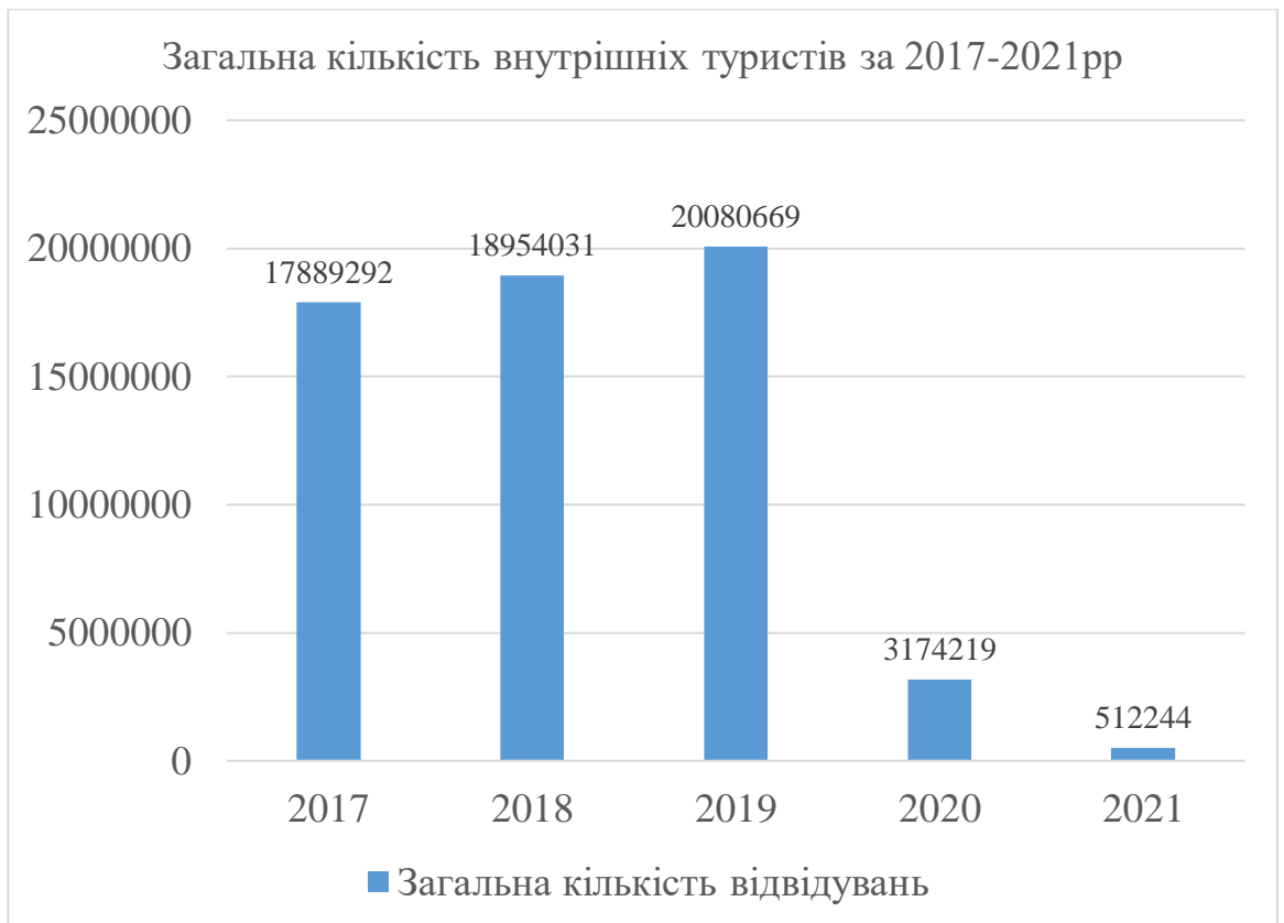
Рис.2.4 Загальна кількість внутрішніх туристів за 2017-2021 роки