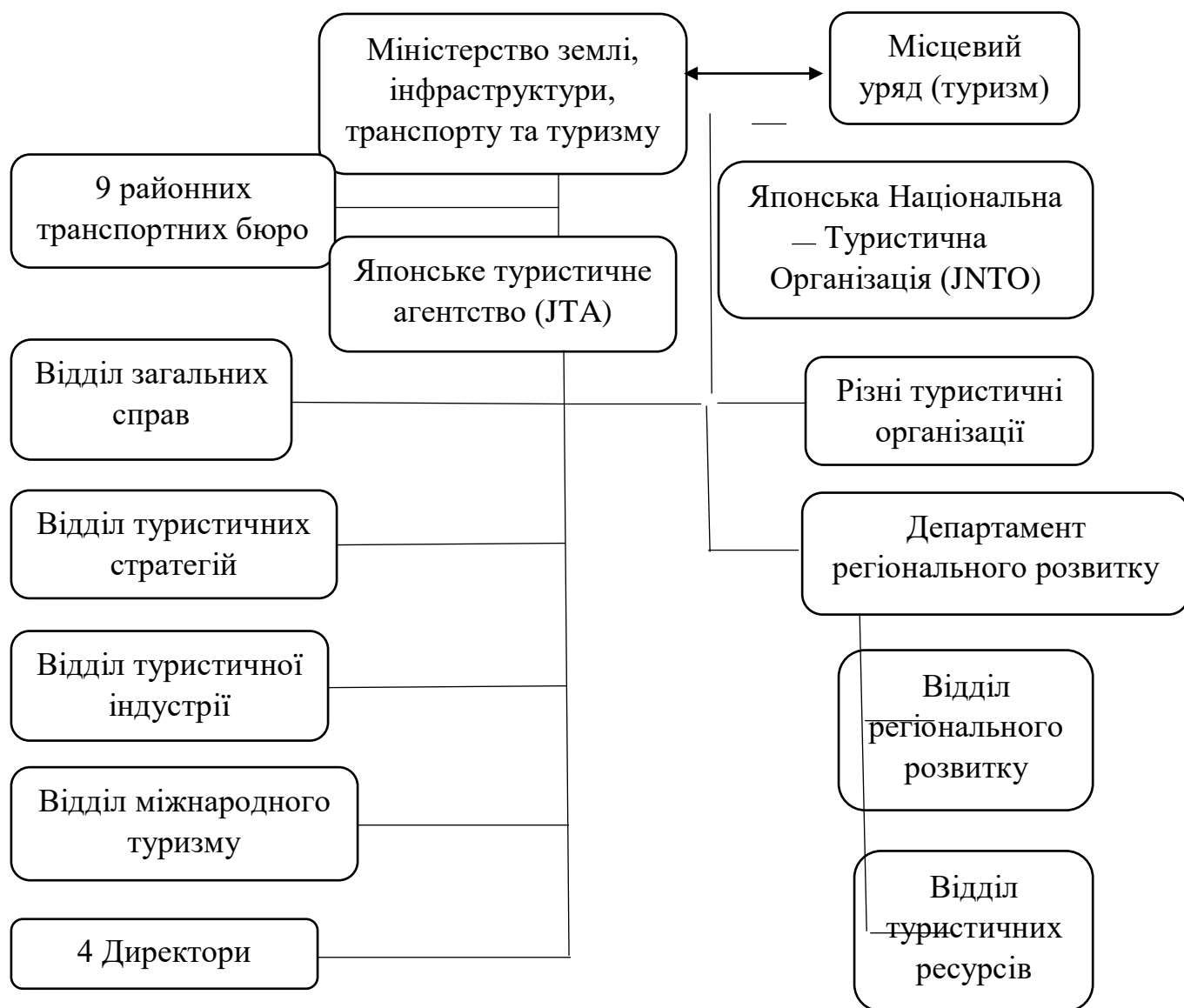
Рис. 2.1 Організаційна схема органів туризму Японії

Уряд Хатоями, який був при владі з вересня 2009 року по червень 2010 року, позиціонував туризм як основну сферу економічного зростання. Під керівництвом міністра Сейдзі Маехари в жовтні 2009 року Міністерство землі, інфраструктури, транспорту та туризму запустило Раду зі стратегії розвитку МЛІТ для вивчення конкретних заходів для стратегії розвитку туризму. Крім того, у грудні 2009 року було створено Офіс сприяння туризму під керівництвом міністра Маехара, який створив єдину урядову структуру для розвитку туристичної нації.