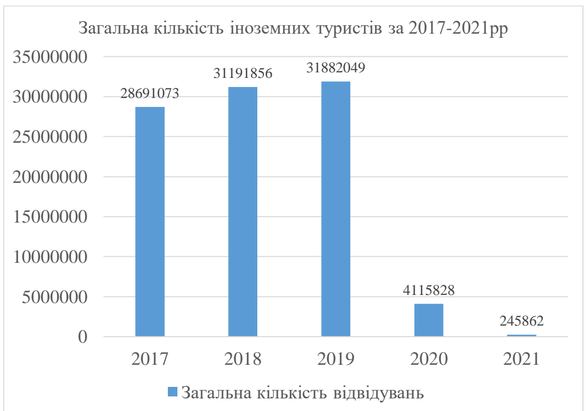
Рис.2.3 Загальна кількість іноземних туристів за 2017-2021 роки