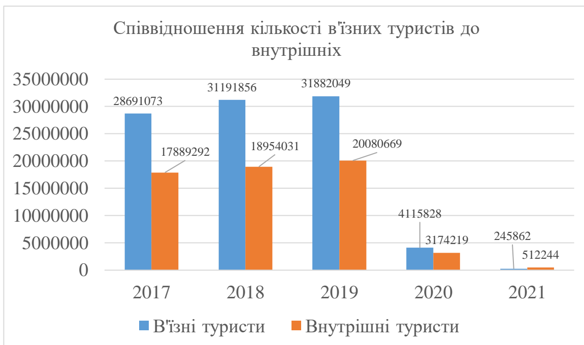
Рис. 2.5 Співвідношення кількості в'їзних туристів до внутрішніх

засоби, де ви можете подорожувати лише з супутниками. Однак використання поїздів, літаків та автобусів зменшилося [12].