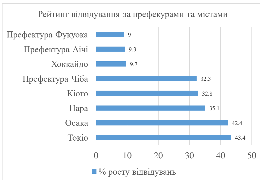
Рис.2.6 Рейтинг відвідуваності туристами найпопулярніших префектур Японії за 2019 рік

На сьогоднішній день найбільшим центром паломництва в Японії є місто Нара, яке є однією зі стародавніх столиць Японії (710-784 роки). Щороку її відвідує понад 3 млн паломників. Впродовж середньовіччя Нара була місцем заточення непокірних аристократів і самураїв у монастирі. В XIX столітті воно залишалось невеликим провінційним містом. З другої половини XX століття місто знову почало активно розвиватися, особливо за рахунок туризму. Кількість відвідувачів особливо зросла після занесення історичної частини міста до списку світової спадщини ЮНЕСКО. Біля монастирів і храмів постійно багато оленів, які вважаються «посланцями богів». Вони не лякаються людей, а навпаки, підходять до них, вимагаючи харчів. В місті Нара знаходиться найбільша статуя Великого Будди в Японії, яка знаходиться в головному залі монастиря Тодайджі. Будівництво храму було завершено в 752 році і з тих пір він продовжує залишатися релігійним місцем. Основні визначні пам'ятки включають будівлі, які були відновлені після знищення пожеж, викликаних війнами, Дайбуцу (великий Будда), шедеври геніїв Ункей і Кайкея, а також статуї божеств-охоронців [16].