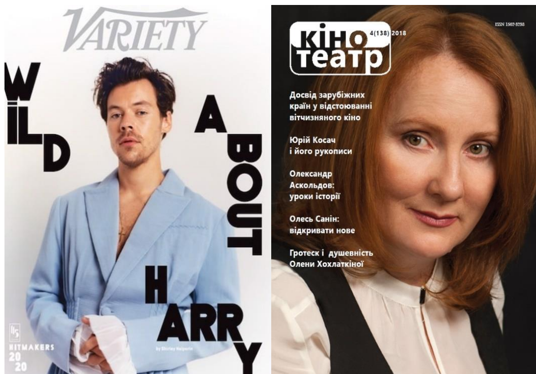
Рис. 1.4. Обкладинка журналу «Variety» (2020 р.) та обкладинка журналу «Кіно-театр» (2018 р.)

Насправді, порівнюючи американський журнал «Variety» з українським сучасним журналом «Кіно-театр», відразу помічаєш велику різницю між ними. Починаючи від обкладинки, закінчуючи оформлення змісту та поданим матеріалом, «Кіно-театр» неабияк програє своєму американському «відповіднику». Не буду заперечувати той факт, що український журнал має багату історію, він єдине тематичне видання, яке пережило усіх своїх конкурентів, але для сучасного часу виглядає він нудно, навіть, застаріло (Рис. 1.4).