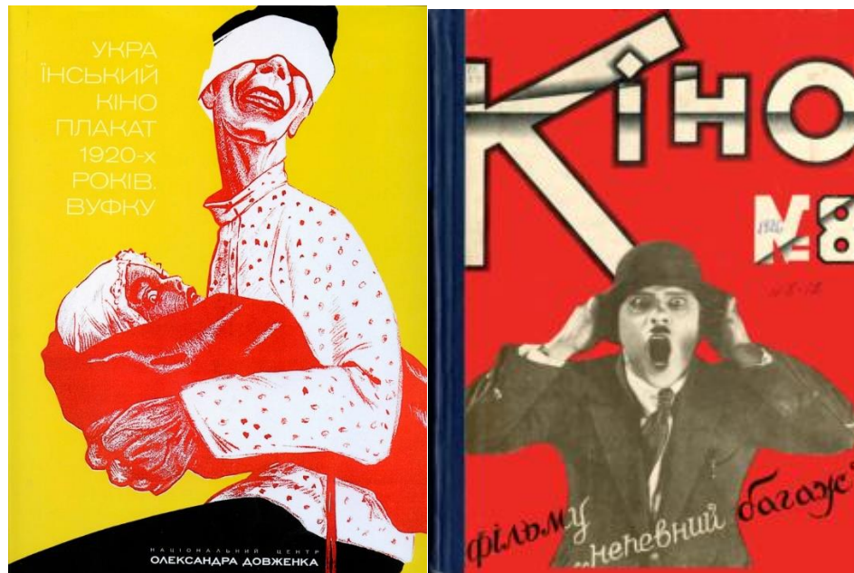
Рис.1.5. Плакат від журналу «Кіно» (ліворуч) та обкладинка «Кіно» (1926 р.)

Проаналізувавши текстові матеріали журналів «Кіно» та «The Hollywood Reporter» стає зрозуміло, що український часопис висвітлював переважно глибини кінематографа, його історію, детально аналізуючи задуми фільмів та їх вплив на тогочасного глядача. В той же час «The Hollywood Reporter» висвітлює переважно клікабельні новинки з американського шоу-бізнесу. Можливо, якби «Кіно» й досі видавався, ми б теж спостерігали таку трансформацію – від глибинного до поверхневого. Не варто забувати, що на «THR» вплинули і новітні технології, і розвиток людського світосприйняття, і світові трансформації. Усі ці чинники, так чи інакше відображаються на контентному наповненні будь-якої сучасної преси. Але все ж, український журнал про кінематограф не просто був новітній, він був інтелігентним та вишуканим, що й робить його один з найяскравіших мистецьких журналів випущених на території України.