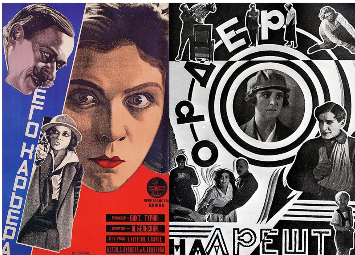
Рис. 1.1. Ілюстрації в журналі «Кіно»

іншого, «Кіно» стає українською лабораторією кінореклами, зокрема блискучої кіноплакатної школи [33] (Рис. 1.1).