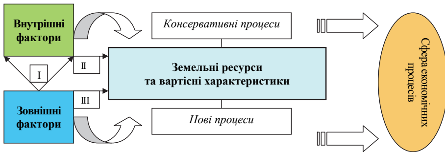
Рисунок 1. Вплив факторів на можливості інтеграції земельних ресурсів до сфери економічних процесів та використання вартісних характеристик:

I – вплив зовнішніх факторів на внутрішні; II – вплив внутрішніх факторів на сферу земельних ресурсів; III – вибіркового вплив зовнішніх факторів на сферу земельних ресурсів