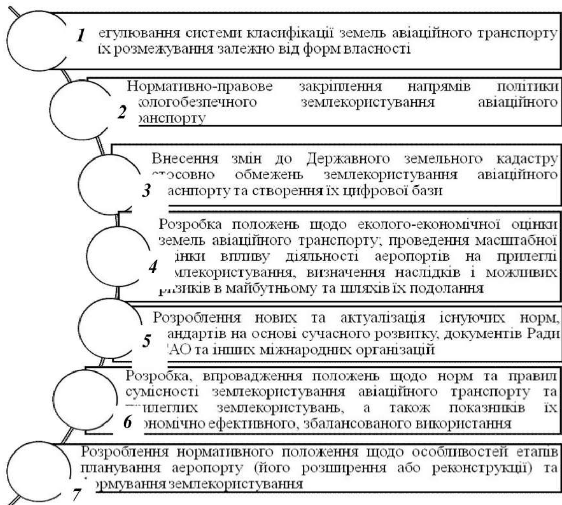
Рис. 2. Можливі напрями вдосконалення нормативного забезпечення землекористування авіаційного транспорту

З огляду на здійснений аналіз виокремимо напрями щодо вдосконалення нормативно-правової бази регулювання землекористування авіаційного транспорту. Вони можуть бути такими (рис 2):