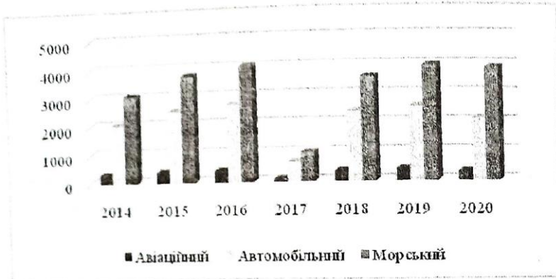
Рис. 1.2. Динаміка обсягів вантажних перевезень за видами транспорту ТОВ «.....», тис. т