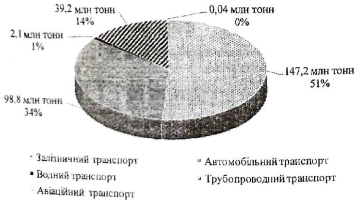
Рис. 1.6. Структура вантажних перевезень в Україні в 1 півріччі 2021 року [12]