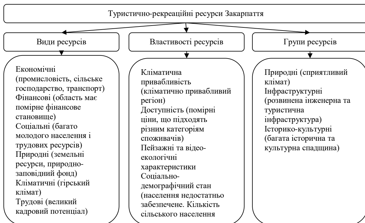
Рис. 2.2. Туристично-рекреаційні ресурси Закарпаття

Все вищесказане підкреслює великий туристичний потенціал та можливості розвитку господарського потенціалу Закарпаття. Опис туристично-рекреаційних ресурсів Закарпаття подано на рис. 2.2.