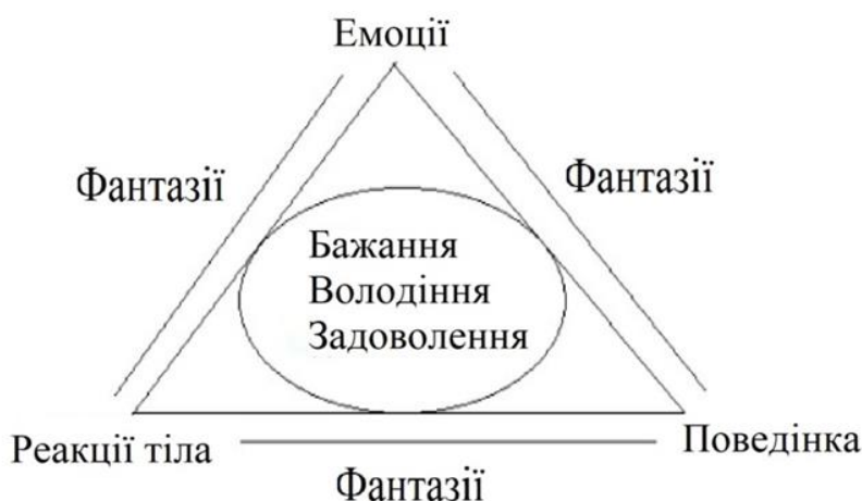
Рис.1. Структура особистості по методу психотерапії «Я-реконструкція» (Павленко Т.В.).

Саме цим критеріям відповідає структура особистості відповідно методу психотерапії «Я-реконструкція» (рис. 1.).