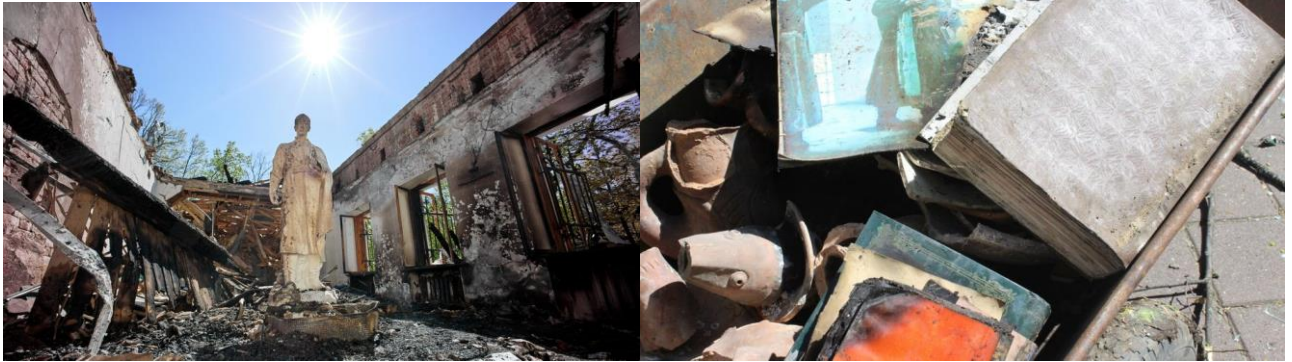
Рис.3.5 та рис.3.6. Знищений музей Г.Сковороди