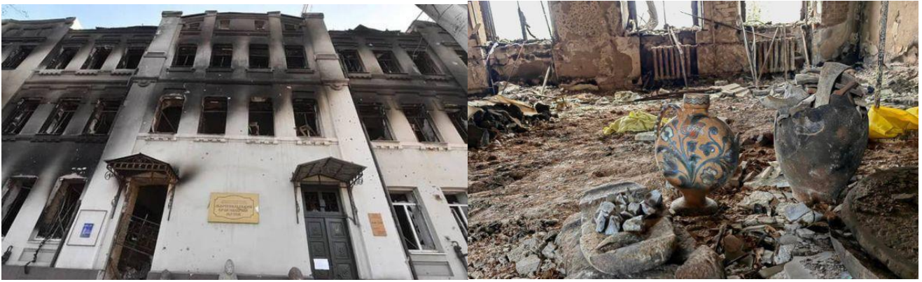
Рис.3.1 та рис.3.2. Зруйнований краєзнавчий музей у Маріуполі Джерело: [33]

Численні обстріли та пожежі пошкодили фасади, вікна та інтер'єри музею, що функціонував з 1920 року. Він розташовувався у старовинній будівлі – т. зв. «Будинку інвалідів». Загальний стан музейних колекцій наразі залишається невідомим (деякі – постраждали від пожежі).