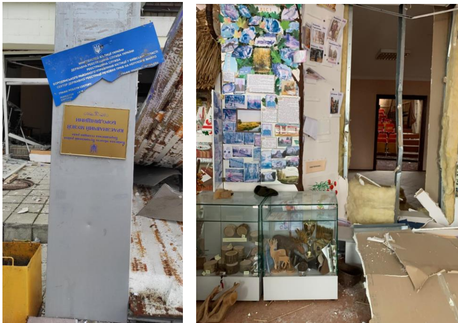
Рис. 3.3 та рис.3.4. Краєзнавчий музей у Бородянці

Російськими обстрілами 2 березня 2022 р. пошкоджено фасади, вікна, інтер'єри та експозицію музею. Загальний обсяг втрачених музейних експонатів та книг розташованої в цій же споруді Бородянської центральної бібліотеки