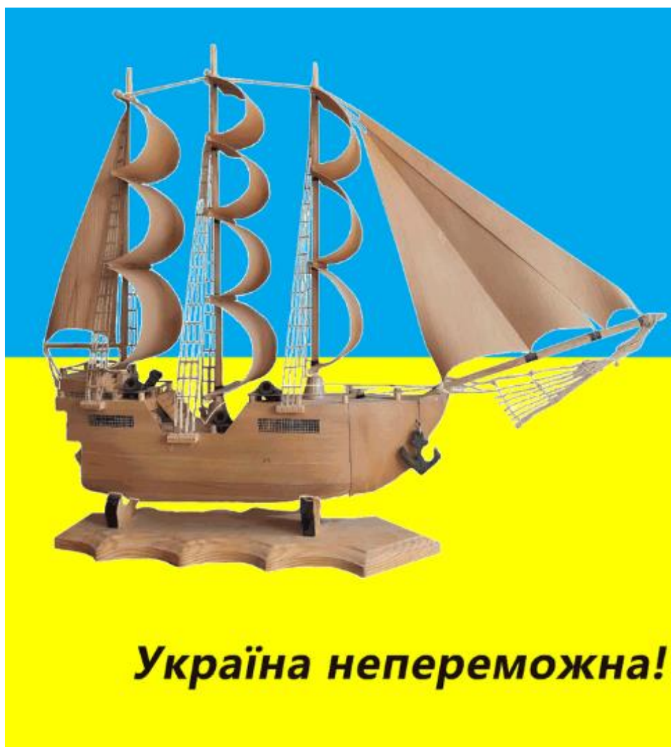
Рис. 2. Розробка патріотичного банеру

Висновки. Засобами редактора Adobe Photoshop розроблено анімований патріотичний банер і розміщено у соціальній мережі Facebook [5]. На рисунку 2 демонструється результат виконаної роботи.