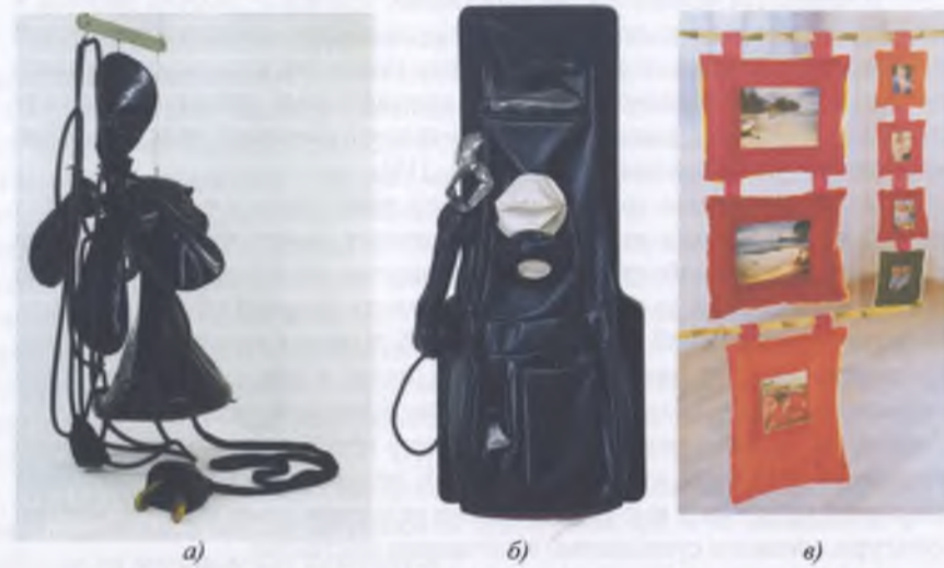
Рис. 1. Метафоричні образи. Застосування незвичайних матеріалів для відтворення художніх витворів та дизайнерських продуктів: а) Гігантський м'який вентилятор, б) М'який телефон-автомат, в) М'яка рамка для фотографій