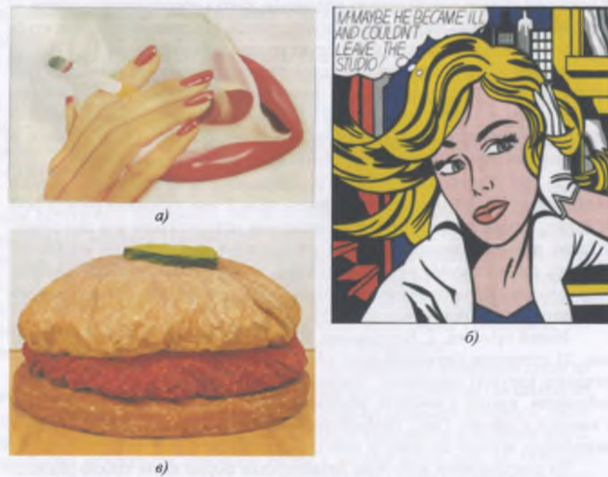
Рис. 2. Зображення гіпертрофованих образів в промисловому дизайні: а) Т. Вессельмана, б) Р. Лихтенштейна, в) К. Ольденбурга