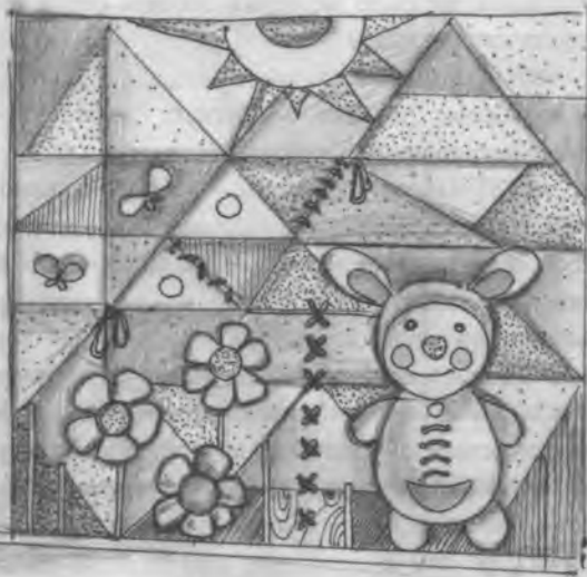
Рис.1. Приклад застосування методики для розвитку моторики і тактильних почуттів в інтер'єрі дитячого центру. Авторська розробка.

Розглянемо застосування цих методик в інтер'єрі на прикладі методики для розвитку моторики і тактильних почуттів. Для дитини, починаючи з піврічного віку можливе декорування стіни або її невеликої ділянки фрагментами різних за фактурою матеріалів. Наприклад, можна використовувати дерево, пластик, метал, камінь, хутро, гладку шкіру, замшу, оксамит, велвет, шовк, мереживо, тафту, фольгу. Оптимальний розмір кожного фрагмента не менше 6 x 10 см, що приблизно відповідає розміру дитячої долоні. Для розвитку моторики усе це можна доповнити зав'язками і стрічками, які можна буде переплітати, зав'язувати між собою і розв'язувати. Таке застосування матеріалів виконуватиме як основну (розвиваючу) функцію для дитини, так і додаткову (декоративну) функцію для самого інтер'єру [3]. Бажане використання різних кольорів і відтінків, різних форм та художніх образів (рис.1).