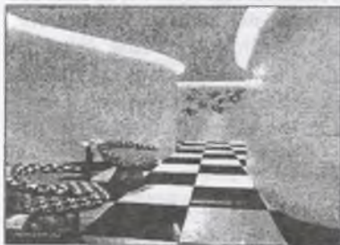
Рис. 1. Інтер'єр готелю в Сінгапурі Spaces

Враховуючи вищезазначені вимоги до готелів такого класу, можна запропонувати наступні дизайнерські рішення. В номерах має бути якомога менше меблів, потрібно використовувати трансформовані меблі, оскільки таким чином можна збільшити місце для розміщення гостей, а також для їх відвідувачів та знизити можливість завдання шкоди майну готелю, адже вболівальники не завжди в змозі стримувати свої емоції та відчуття, під час перегляду спортивних змагань. Загромадженість меблями можна замінити поєднанням різних відтінків стін, підлоги, стелі. Вболівальникам особливо прийде до смаку, якщо розробити номера готелів в кольорах та стилістиці