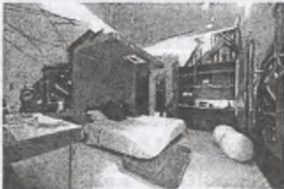
Рис. 2. Готель Permanent Hospitality