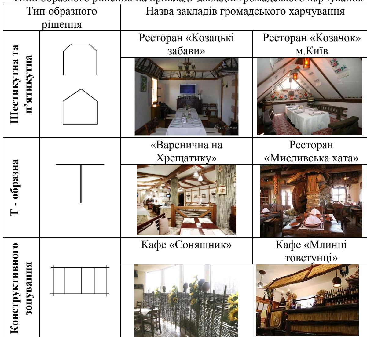
Типи образного рішення на прикладі закладів громадського харчування

Одним з головних способів у формуванні образності приміщень виступає колір та композиційні способи, зокрема точка, лінія, пляма, фактура та текстура.