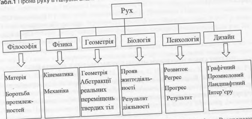
Табл.1 Прояв руху в галузях знань

не існує як звичайний вираз, його трактовка може мати двозначність. Розглядаючи окремо кожне поняття, суть вислову буде погано зрозумілою. Тільки вивчаючи комплексно і системно дані явища, можна дати чітке визначення.