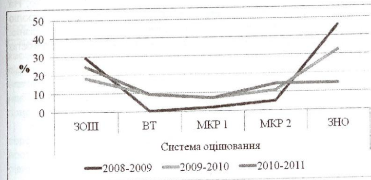
Рис. 2. Моніторинг динаміки високого рівня знань із математики залежно від систем контролю

Статистичні дані, представлені у таблиці 2, свідчать про значний рівень неузгодженості показників високого рівня навчальної успішності школярів у середніх загальноосвітніх навчальних закладах та в системі доуніверситетської підготовки, в тому числі їх невідповідність результатам зовнішнього незалежного оцінювання (див. рис. 2).