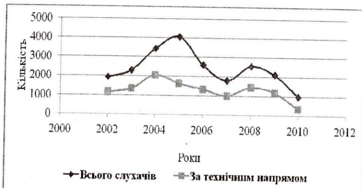
Рис. 1. Співвіднесення кількості слухачів технічного напрямку підготовки у системі доуніверситетської підготовки та загальної кількості слухачів

Виходячи з вимог до здійснення моніторингу успішності навчальних досягнень, важливим фактором його здійснення в Інституті доуніверситетської підготовки вважаємо кількість слухачів технічного напрямку, що бажають пройти підготовку з математики (див. рис. 1).