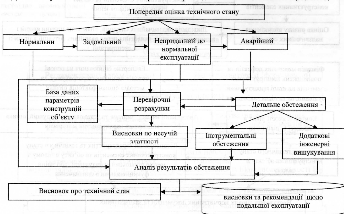
Рис. 1. Структурна схема оцінки технічного стану конструкцій / Structural model for assessment of technical state of the structure

При аналізі небезпек складні системи розбивають на підсистеми. Підсистеми виділяють за певною ознакою, що відповідає конкретним цілям і задачам функціонування системи. Підсистема може розглядатися як самостійна система, що складається