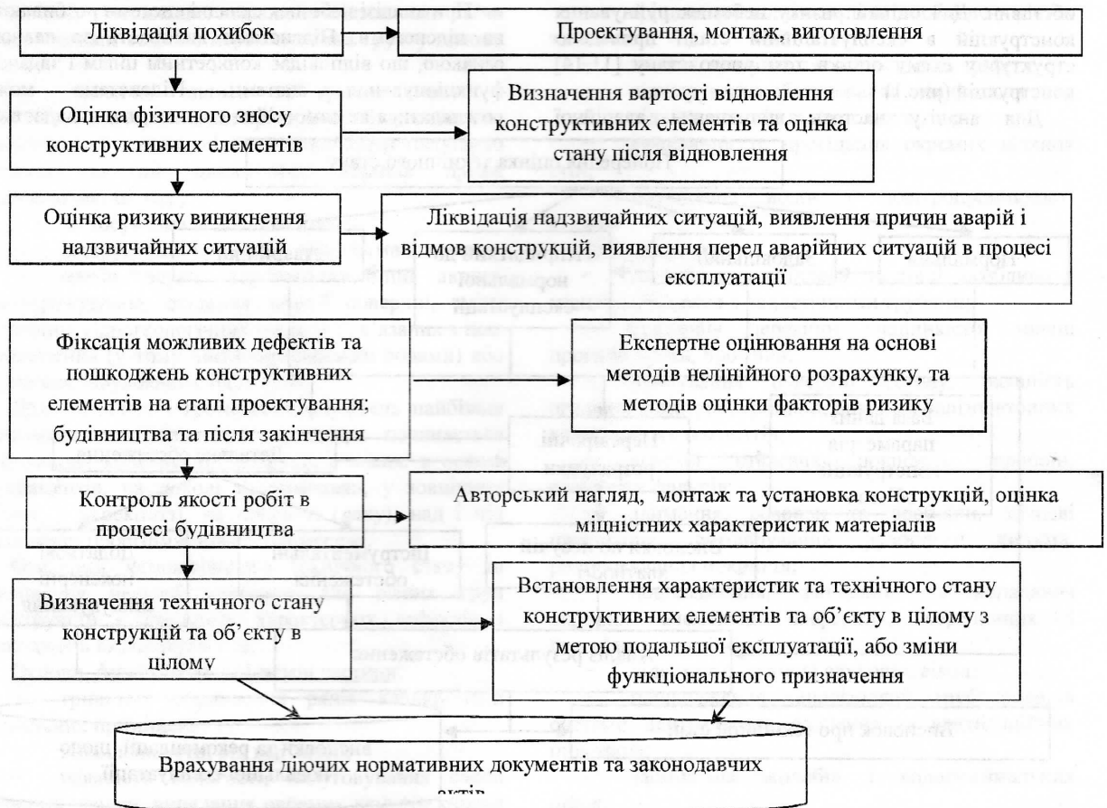
Рис. 2. Структурна схема можливих факторів, що можуть призвести до аварійної ситуації / Structural model for possible factors that may cause emergency situation

Аварійна ситуація [2] призводить до повної або часткової відмови конструктивного елемента або системи в цілому. Для оцінки наслідків виникнення аварійної ситуації (відмови) в конструктивному елементі враховується критерій важливості елементу в системі та враховується його розташування.