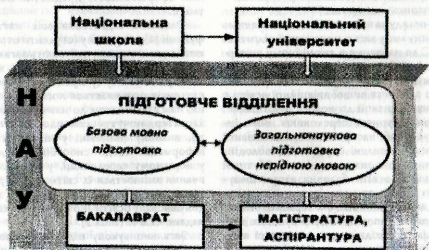
Рис.1. Освітній шлях іноземних студентів, які навчаються у НАУ

Таким чином, навчання на ПФ (ПВ) повинно сформувати у іноземного студента готовність до подальшого здобуття освіти у вищій школі. Для організації роботи з формування означеної готовності, окрім з'ясування сутності цього процесу, важливе значення має розробка відповідного інструментарію для діагностування рівня розвиненості зазначеної властивості у іноземних студентів, що було наступним етапом нашого дослідження.