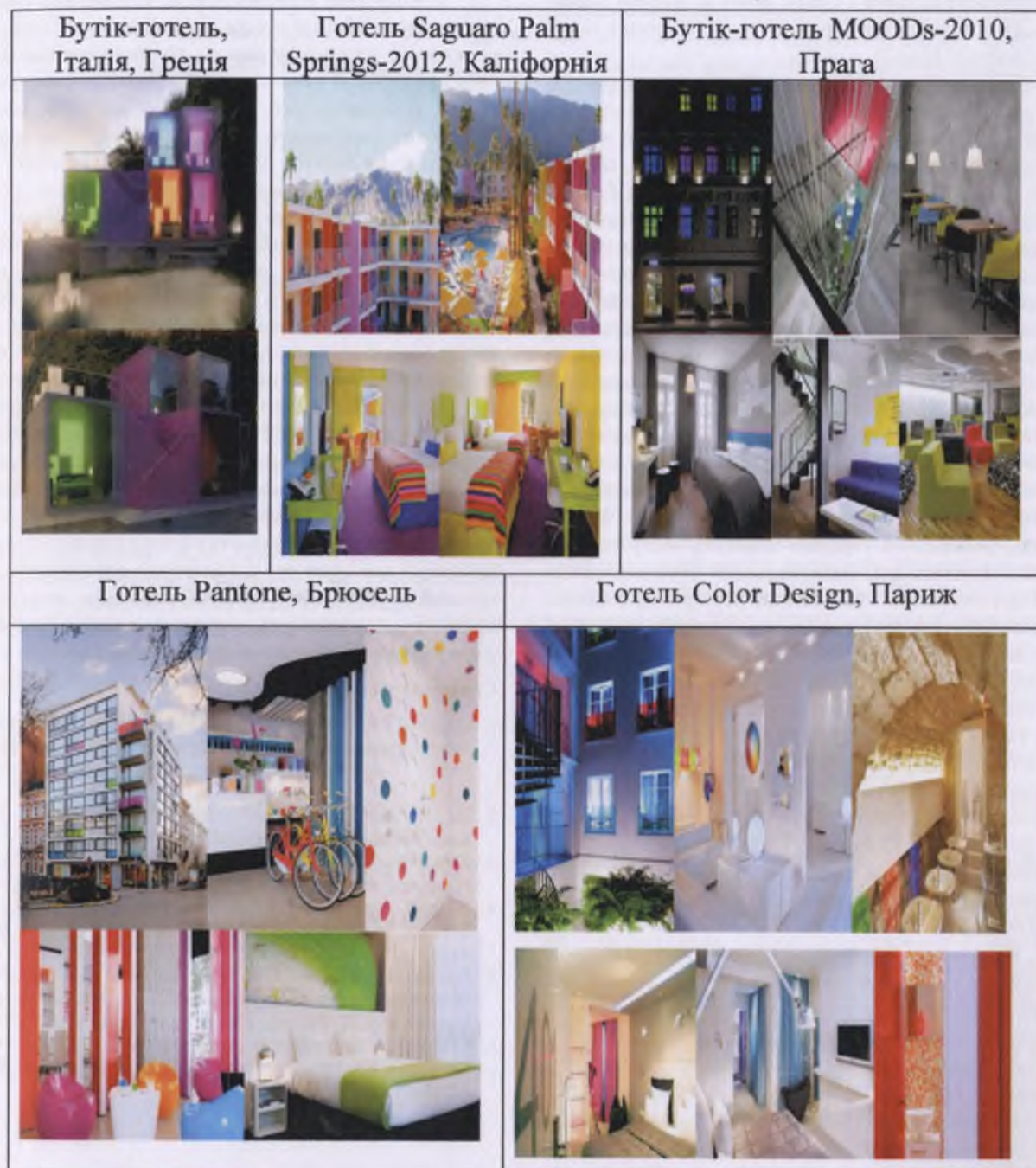
Рис.2 Застосування комбінацій кольору в малих готелях