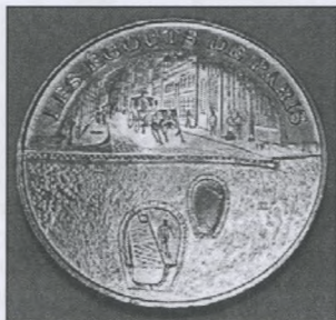
Рисунок 2. Монета на честь каналізаційної служби Парижу [5]

фотографують, створюють сторінки в соціальних мережах, відкривають музеї, запроваджують конкурси та виставки. В Парижі існує «Музей Великого Круглого». Відвідувачі можуть отримати маленькі моделі люків, виконані в формі монети (рис. 2).