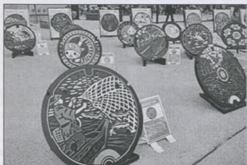
Рисунок 3. Виставкова експозиція конкурсних пропозицій розпису кришок люків оглядових колодязів [6]

Особливу увагу слід приділити досвіду Японії. По-перше, кришки люків виготовлюються з чорного полімеру, який легко утилізується; по-друге, вони мають яскраві кольорові зображення. Існує спеціалізована рекламно-інформаційна організація «Інформаційна платформа каналізації», заснована з ініціативи Міністерства земель, інфраструктури, транспорту та туризму Японії. Сама вона займається поширенням інформації про каналізаційні системи, випускає картки із зображенням люків, проводить різноманітні заходи з удосконалення дизайну та випускає тематичні сувеніри із зображенням результатів їх творчої роботи. Кожен з 1700 населених пунктів Японії розробляє свій власний, не схожий на інші дизайн. Здається, що японці помістили в цей невеликий 60-ти сантиметровий диск окремий всесвіт: кришки люків як планети розкидані по містам, прикрашаючи буденні вулиці (рис. 3).