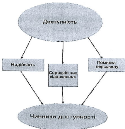
Рис. 1. Критерій доступності

На рис. 1 представлені елементи що входять в критерій доступності.