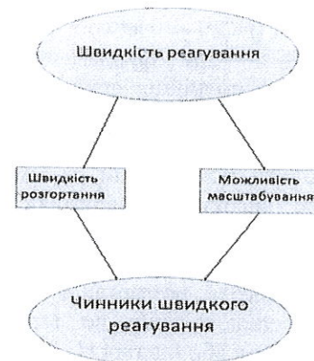
Рис. 2. Критерій швидкості реагування

• забезпечити, щоб система приймала і легко обробляла постійні зміни, не сприяючи виникненню помилок з боку людського чинника.