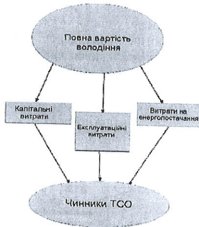
Рис. 3. Критерій повної вартості володіння

Терміном «повна вартість володіння» або «ТСО» виражаються витрачені кошти (рис. 3).