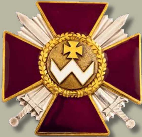
Знак ордена Богдана Хмельницького II ступеня

Badge of the Order of Bogdan Khmelnytsky of the II class