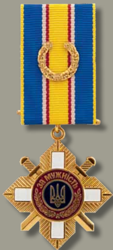
Знак ордена «За мужність» II ступеня

Badge of the Order «For Courage» of the II class