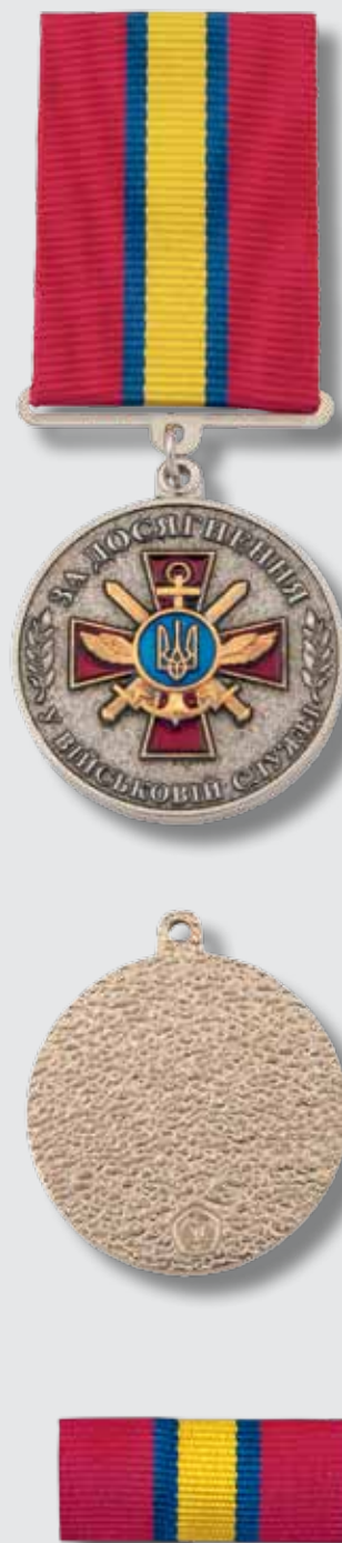
Почесний знак «За досягнення у військовій службі» II ступеня

Розмір планки – 28 x 12 мм. Планка знаку являє собою металеву пластинку, обтягнуту стрічкою. Стрічка нагрудного знака II ступеня шовкова муарова малинового кольору з поздовжніми двома синіми і одною жовтою смужкою посередині.