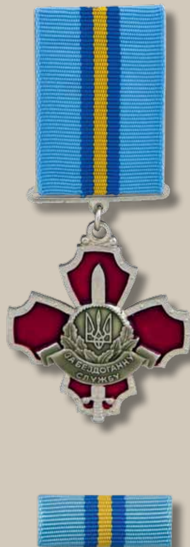
Медаль «За бездоганну службу» I ступеня

Розмір планки – 28 x 12 мм. Планка медалі являє собою металеву пластинку, обтягнуту стрічкою. Стрічка медалі шовкова муарова блакитного кольору з поздовжніми жовтими і синіми смужками з боків.