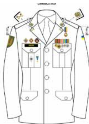
На парадному стилі генерала Збройних Сил України мал. 1

The order of wearing orders, medals and other awards on the uniform of military personnel of the Armed Forces of Ukraine