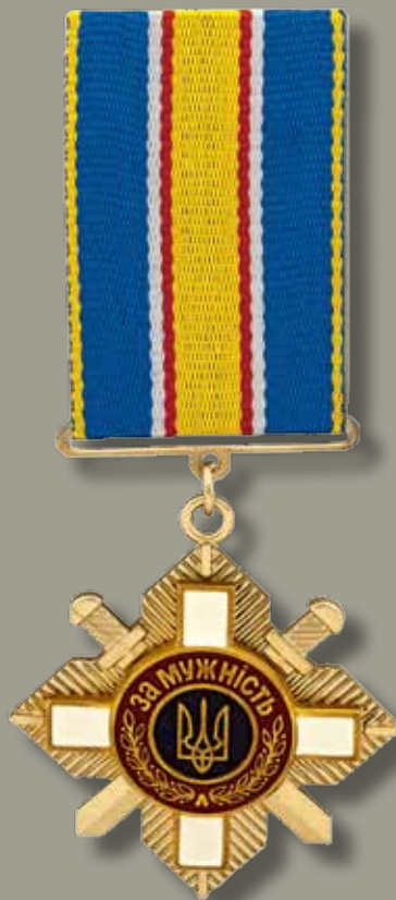
Знак ордена «За мужність» III ступеня

Badge of the Order «For Courage» of the II class