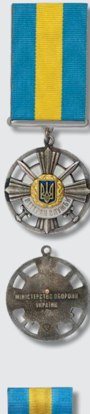
Медаль «Ветеран служби»

Розмір планки – 28 x 12 мм. Планка медалі являє собою металеву пластинку, обтягнуту стрічкою. Стрічка медалі шовкова муарова блакитного кольору з однією поздовжньою смужкою у центрі шириною 10 мм.