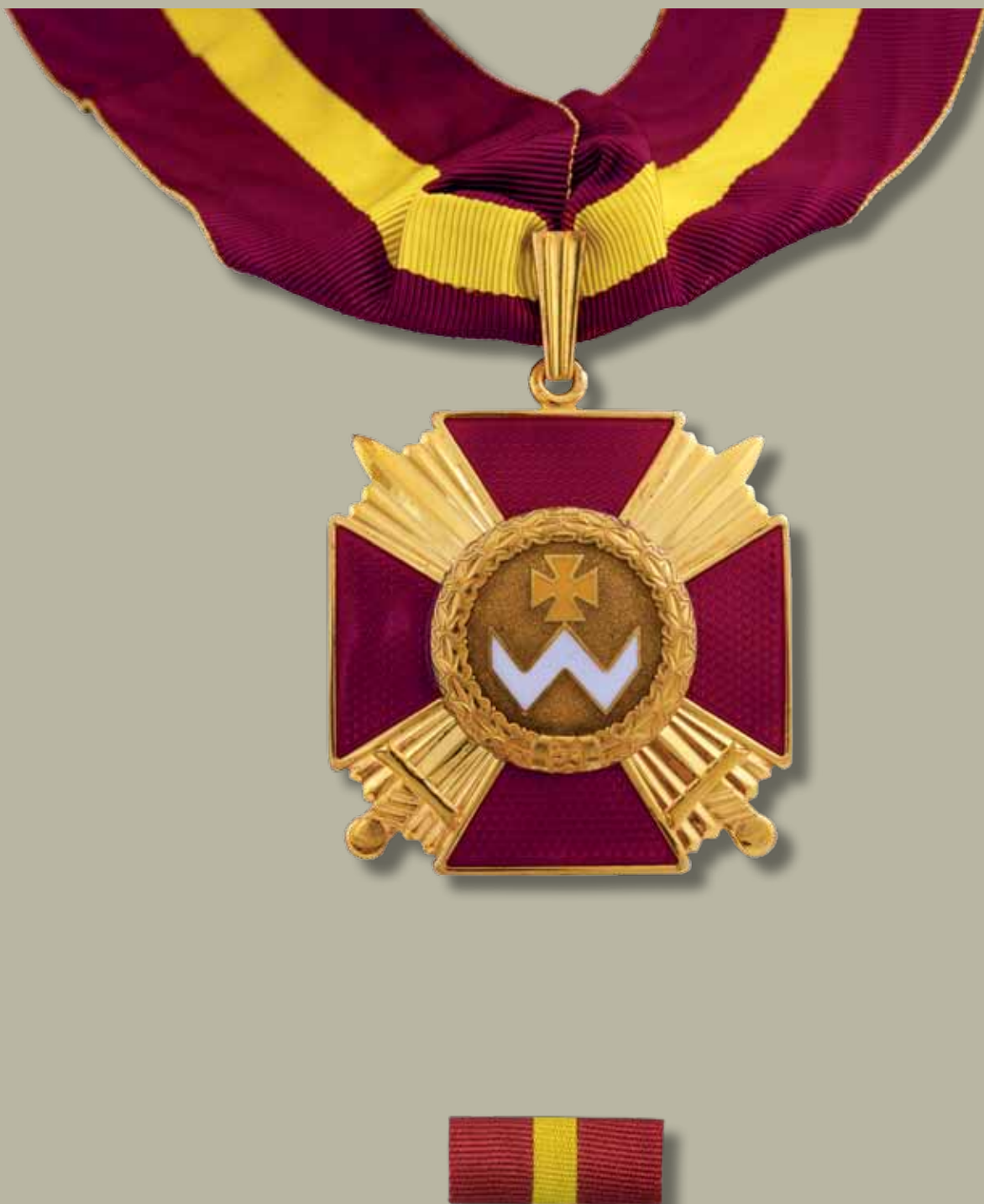
Знак ордена Богдана Хмельницького I ступеня

Badge of the Order of Bogdan Khmelnytsky of the I class