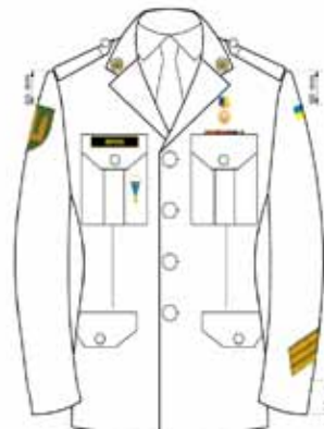
На стилі курсанта Збройних Сил України мал. 8