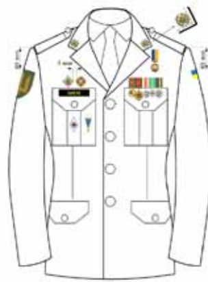
На парадному стилі офіцерського, сержантського та рядового складу Збройних Сил України мал. 2