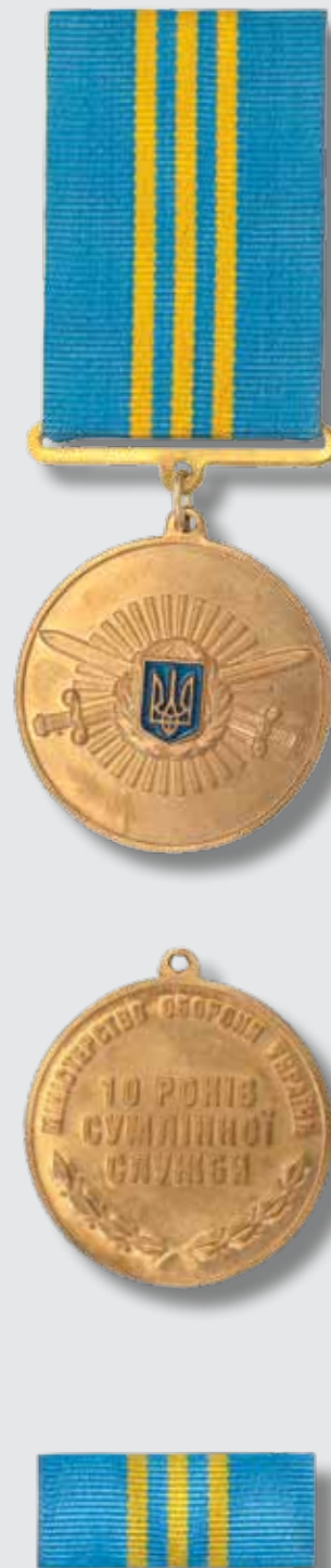
Медаль «10 років сумлінної служби»

Розмір планки – 28 x 12 мм. Планка медалі являє собою металеву пластинку, обтягнуту стрічкою. Стрічка медалі шовкова муарова блакитного кольору з трьома поздовжніми смужками у центрі шириною 2 мм, відстань між смужками 2 мм.