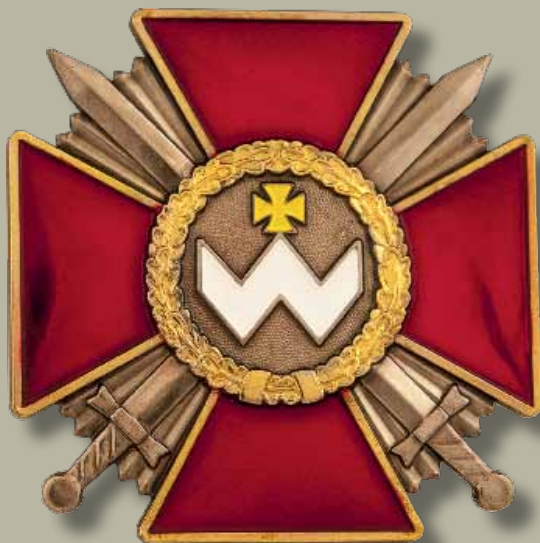
Знак ордена Богдана Хмельницького III ступеня

Badge of the Order of Bogdan Khmelnytsky of the III class