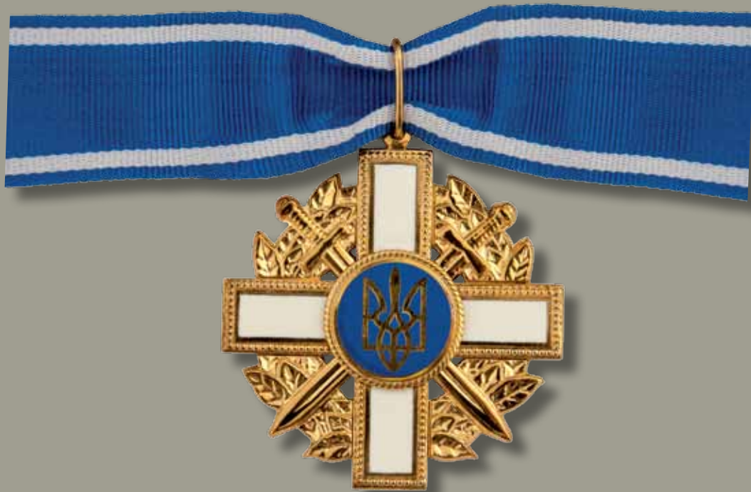
Знак ордена «За мужність» I ступеня

Badge of the Order «For Courage» of the I class