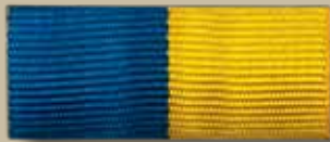
Орден «Золота Зірка» звання Герой України Орден Держави звання Герой України Мініатюра орденів звання Герой України