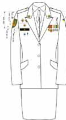
На парадному стилі військовослужбовців інших Збройних Сил України мал. 5