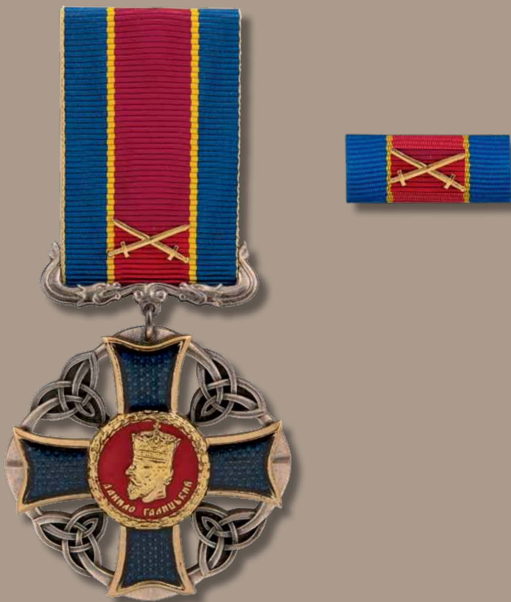
Знак ордена Данила Галицького з мечами