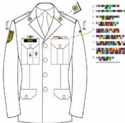
На парадно-виїздовому та повсякденному стилі офіцерського, сержантського та рядового складу Збройних Сил України мал. 7