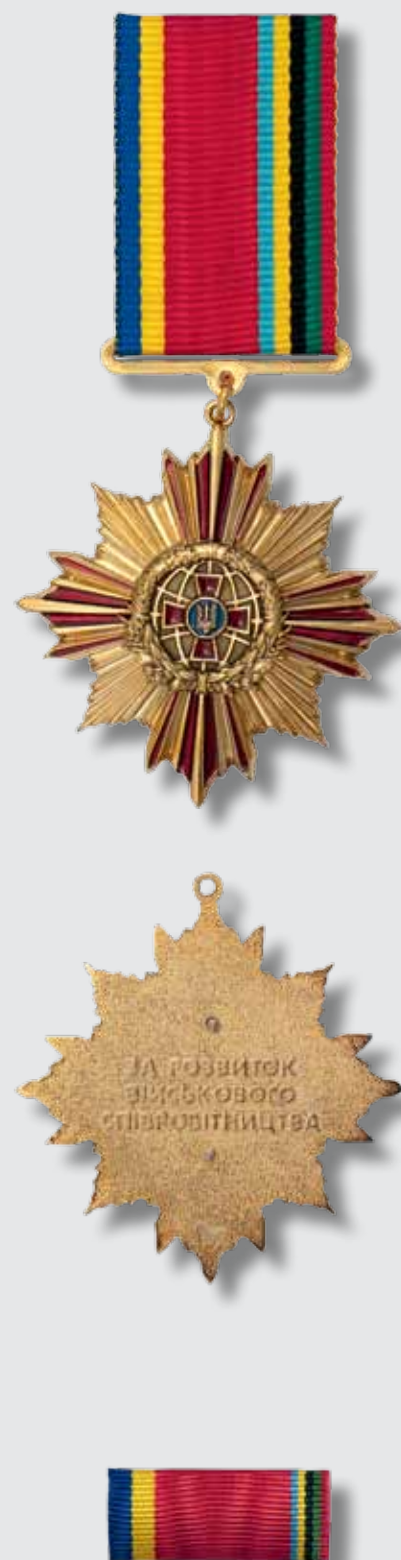
Нагрудний знак «За розвиток військового співробітництва»

Розмір планки – 28 x 12 мм. Планка медалі являє собою металеву пластинку, обтягнуту стрічкою. Стрічка відзнаки шовкова муарова бордового кольору з повздовжніми смужками синього і жовтого, блакитного, чорного, зеленого та бордового кольорів з країв. Ширина синьої і жовтої смужок – по 3 мм кожна, блакитного, жовтого, чорного, зеленого та бордового кольорів – по 2 мм кожна.