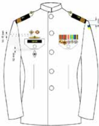
На парадному стилі військовослужбовців Військово-Морських Сил Збройних Сил України мал. 3