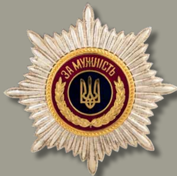
Зірка ордена «За мужність» I ступеня

Star of the Order «For Courage» of the I class