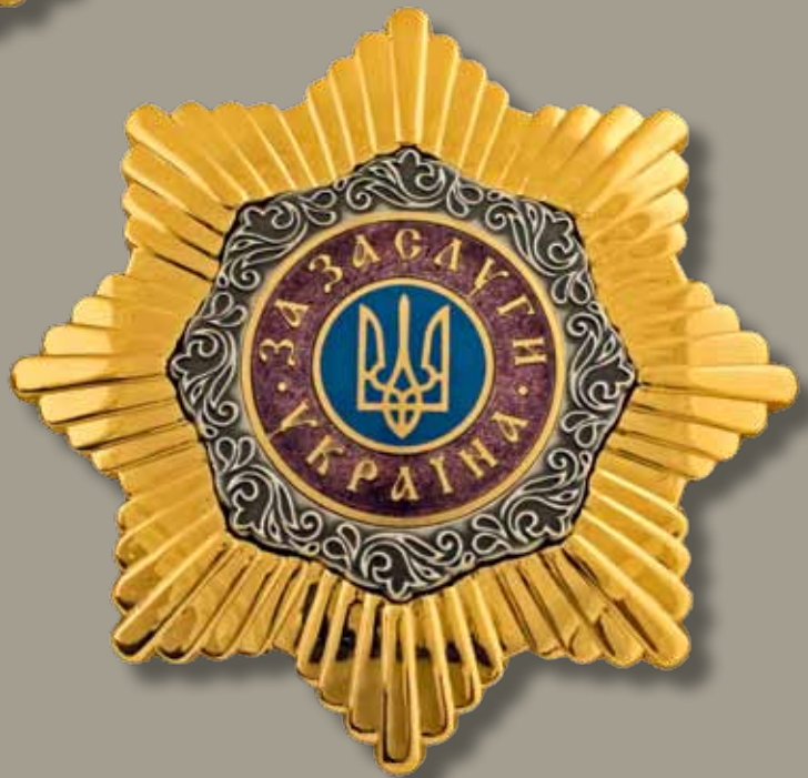
Знак та зірка ордена «За заслуги» I ступеня

The badge and the star of the Order of Merit of the I class