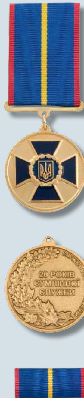
Медаль «20 років сумлінної служби»

Розмір планки – 28 x 12 мм. Планка медалі являє собою металеву пластинку, обтягнуту стрічкою. Стрічка медалі муарова, синього кольору з повздовжньою смужкою жовтого кольору посередині та малиновими з боків.