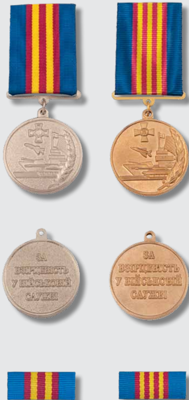
Почесний знак «За взірцевість у військовій службі» II ступеня

Розмір планки – 28 x 12 мм. Планка знаку являє собою металеву пластинку, обтягнуту стрічкою.