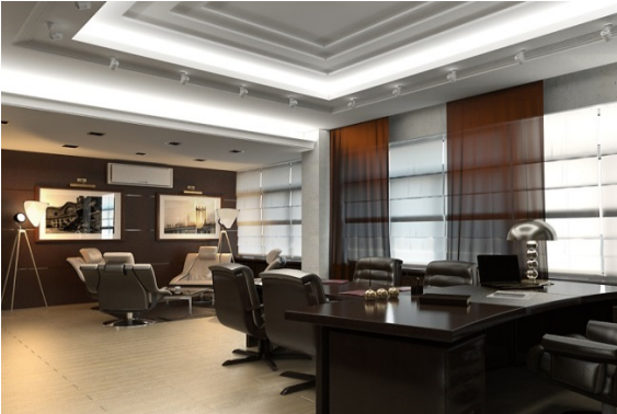
Рис.3. Респектабельний офіс. Україна. А. Могила

уважністю, не варто боятися експериментувати з ним. За допомогою кольору можна створювати не тільки естетично гармонійний простір в який і співробітники, і відвідувачі будуть приходити із задоволення [3]. Для юридичних та фінансових компаній більш характерним є застосування теплих природних кольорів і фактур, оскільки середовище офісу компанії повинно створювати відчуття стабільності та благополуччя (рис. 3).