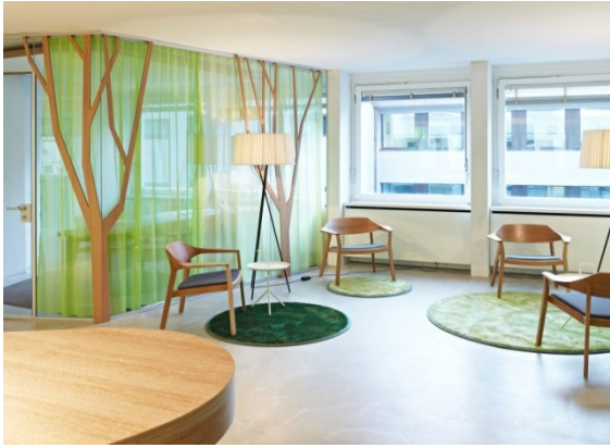
а) Зона відкритих переговорів