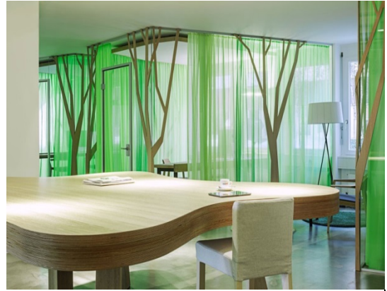
б) Зона закритих переговорів