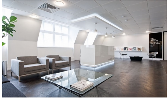
Рис.4. Офіс Louis Vuitton Moët Hennessey м. Лондон

Такі насичені кольори як глибокий синій, темно-зелений та бордовий вселяють впевненість, свідчать клієнту про почуття вашого контролю ситуації — тому часто застосовуються в офісах торгово-промислових компаній, які працюють з корпоративними клієнтами. Більш яскраві, чисті кольори характерні для офісів компаній, які працюють на економічний ринок — найчастіше, це кольори бренду, корпоративні кольори, у сполучності з колірними акцентами, які доповнюють їх. Продумані колірні рішення інтер'єру офісу створять необхідне враження про фірму, поліпшать клімат в колективі і навіть сприяють підвищенню активності. Потрібно дотримуватись колориту композиції, що визначається домінуючими кольорами близьких відтінків [4]. Якщо в інтер'єрі переважають сіро-блакитні тони, то при наявності в ньому незначних елементів жовтого, коричневого та білого кольорів він сприймається в сіро-блакитному колориті. Гармонія в інтер'єрі офісу, сприяє високій художній виразності. Стан спокою досягається шляхом урівноваження колірної гама поверхонь [1].