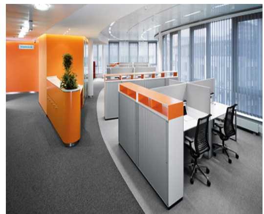
Рис. 3 Modern Office Storage Furniture Design

Стіни несуть найбільше колірне навантаження в інтер'єрі, а також є фоном для меблів і декоративних предметів (рис. 2). Спокійний фон надає меблям велику виразність і, навпаки, яскраво забарвлені стіни з великим орнаментом створюють строкатість. Якщо меблі масивні, то краще вони будуть виглядати в інтер'єрі з білими стінами. З яскравими стінами будуть органічно поєднуватися прості однотонні меблі. До підбору кольору потрібно ставитися з особливою