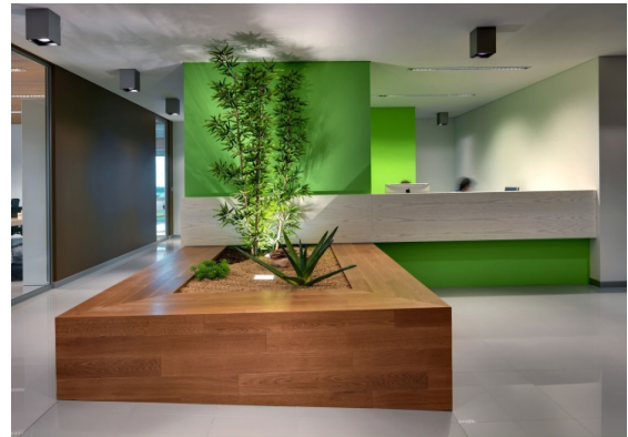
б) Зона очікування