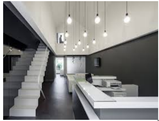
б) Транзитна зона