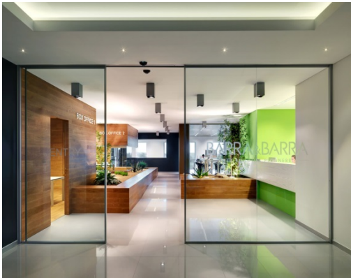
а) Транзитна зона офісу

Здавна особливу увагу приділяли кольорам меблів та предметів інтер'єру, а також архітектурних споруд, що призвело до існуючого сьогодні різноманіття видів і типів оздоблення поверхонь, а сучасні досягнення у виробництві барвників створюють практично необмежений вибір кольорів та відтінків оздоблювальних матеріалів [6].