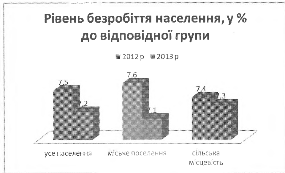
Рис.3. Рівень безробіття населення, у % до відповідної групи

Загальний рівень безробіття зменшився на 0,3%, зокрема серед жінок на 0,2% і серед чоловіків на 0,5%. Найбільший рівень безробіття спостерігається серед молоді віком 17-24 роки, і становить 17,4% (збільшення на 0,1%). Найменший рівень безробіття серед осіб віком 50-59 років, і становить 5,1% (рис.3).