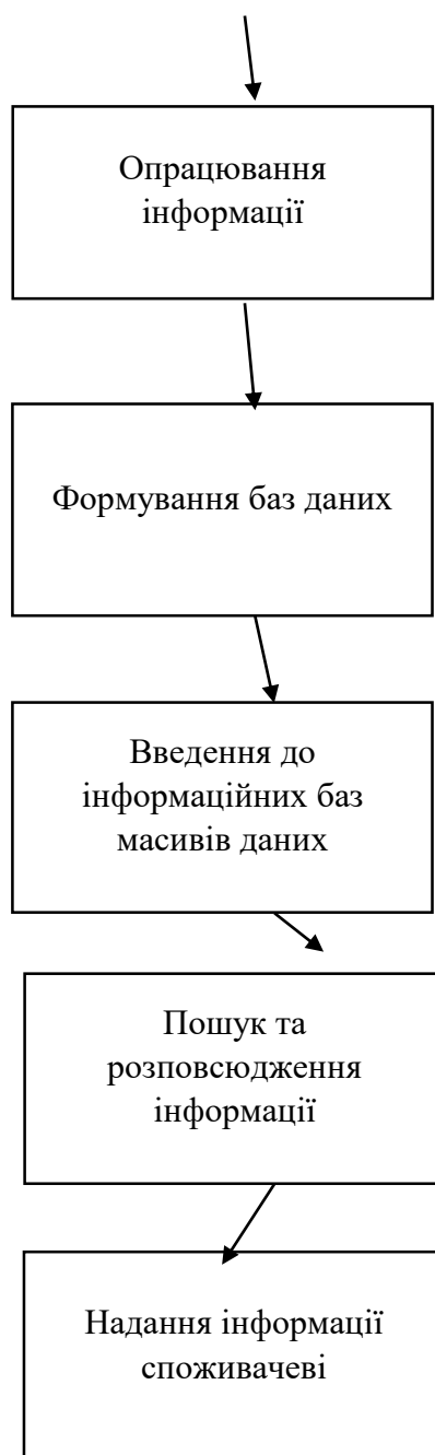
Рис. 1.2.1. Етапи інформаційної діяльності бібліотечних установ

Однак вже у 1900-тих роках наукова та інформаційна діяльність були розподілені на 2 рівноцінні системи. З того часу інформаційна діяльність була