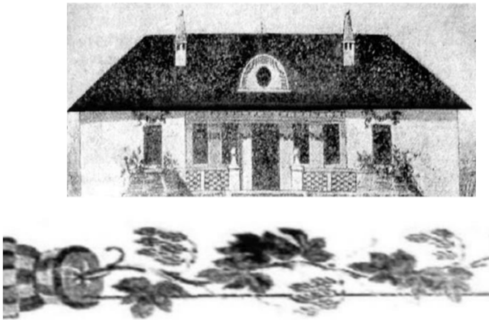
Рис. 1.1 Фронтальна композиція головного фасаду будівлі архітектора С. Б. Князєв, 1938 р.

У 1926-1927 рр. республіку перетворюють в індустріальний центр. Велику роль у виконанні цих планів повинна була відіграти жінка-робітниця. Тому на Х з'їзді КП(б)У в 1927 р. передбачалося розширення заходів з охорони жіночої праці на виробництві та розширення мережі дитячих дошкільних закладів із метою найбільшого використання праці робітниць [8]. У 40-50% випадків дитячі дошкільні заклади проектувалися та розміщувалися на перших поверхах житлових і громадських будинків. У 1928 році були розроблені офіційні норми проектування дитячих дошкільних закладів з визначенням площі дитячого садка. Про велику увагу до архітектури дитячих дошкільних закладів свідчить один із типових проєктів дитячих ясел на 50 місць (архітектор С. Б. Князєв, 1938 р. ). Своєрідна фронтальна композиція головного фасаду будівлі заснована на поєднанні та чергуванні різноманітних візерунків площин дерев'яних елементів (рис. 1.1).