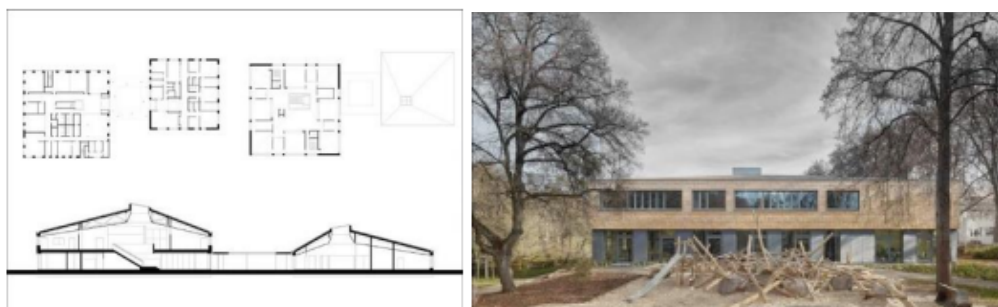
Рис. 3.1 План та фасад Дитячий центр-початкова школа, Тюбінген, Німеччина, 2016

Першим прикладом сучасної дошкільної освіти в Німеччині є проєкт штутгартської студії (Se) arch Architekten (3.1), який об'єднує початкову школу та дитячий центр у Тюбінгені, розташованих у лісистій місцевості на березі річки Неккар.