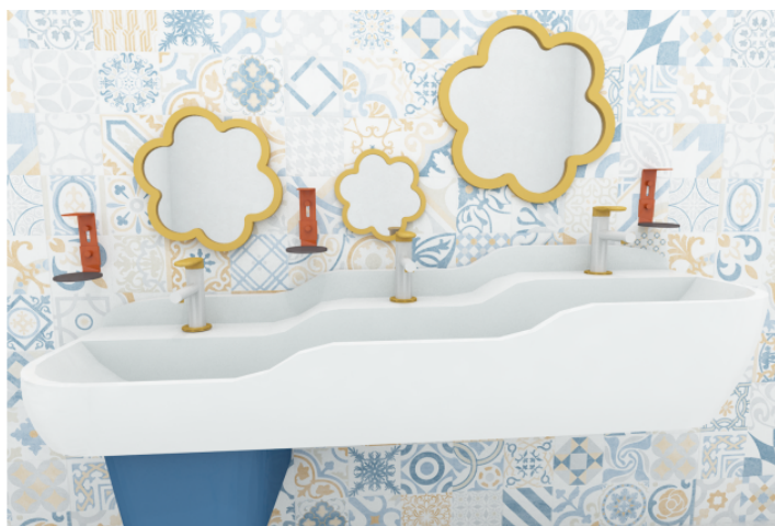
Рис. 3.2 Авторські розробки

Тримач для мила розташований поруч з раковиною або на рукомийнику. Він має зручну форму, що дозволяє легко тримати мило і не допускає його ковзання чи падіння. Це допомагає забезпечити чистоту та охайність в приміщенні, а також розвиває навички самообслуговування.