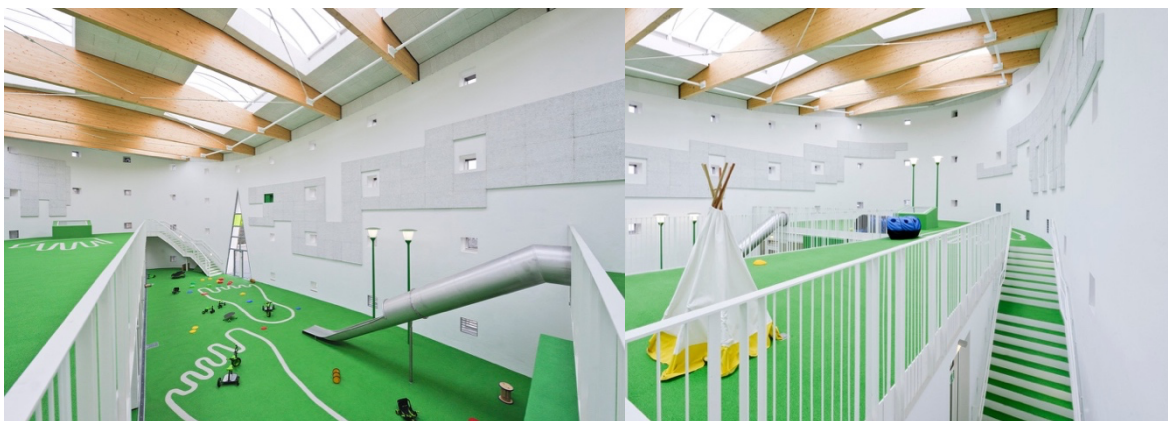
Рис. 1.3.3 Садок св. Себастьяна Bolles + Wilson

Особливістю об'єкта є те, що він є проєктом-ілюстрацією реконструкції церковного приміщення під нову функцію дошкільного закладу. Дитячий садок розрахований на три групові приміщення на першому поверсі та дві групи на