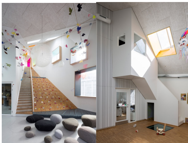
Рис. 3.3 Відкритий простір «Børnekulturhus Ama'r» у Копенгагені, Данія

Не менш цікавий приклад інтер'єру дитячого садка є "Børnekulturhus Ama'r" у Копенгагені, Данія. Розроблений так щоб забезпечити візуально привабливий і функціональний простір для дітей. Меблі та загальний стиль інтер'єру створюють атмосферу, яка є водночас естетично привабливою та зручною для дітей (рис. 3.3.)