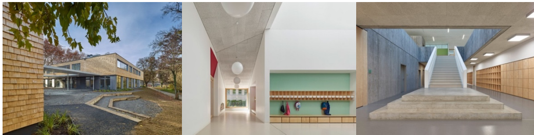
Рис. 3.2 Приклади інтер'єру дитячого центру-початкової школи, Тюбінген, Німеччина, 2016

таким чином, щоб запропонувати вільний простір для зустрічей і взаємодії, а також отримати більш комфортну аудиторію, розташовану на верхньому поверсі(Рис. 3.2).