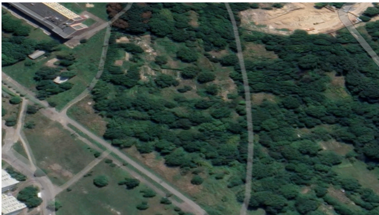
Рис. 3.1 Генплан розташування

зокрема ДБН В.2.2-9:2018 "Громадські будинки та споруди" та ДБН В.2.2-4:2018 "Заклади дошкільної освіти".